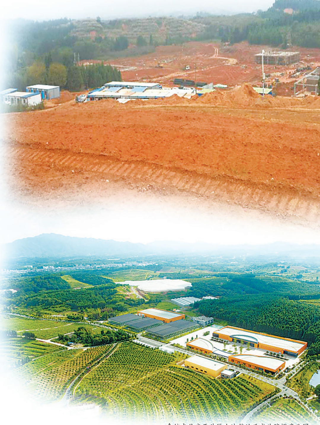
↑信丰县安西片区土地整治后成为脐橙产业园。