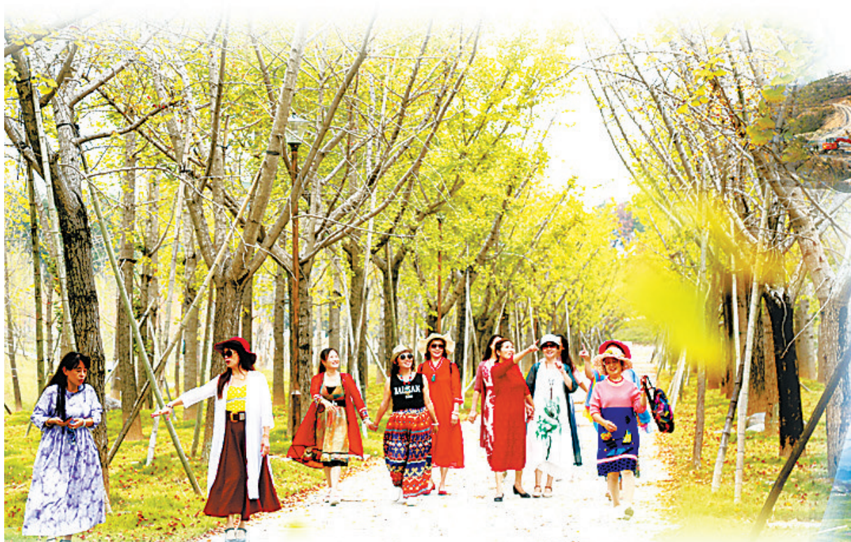
↑大余县滴水龙废弃稀土矿区外围0.6平方公里纳入废岭风情园打造。