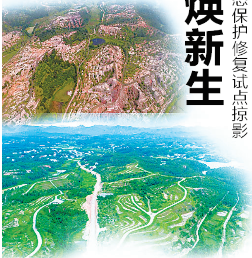
↑赣县区金钩型崩岗群治理后,成为绿意盎然的草原。