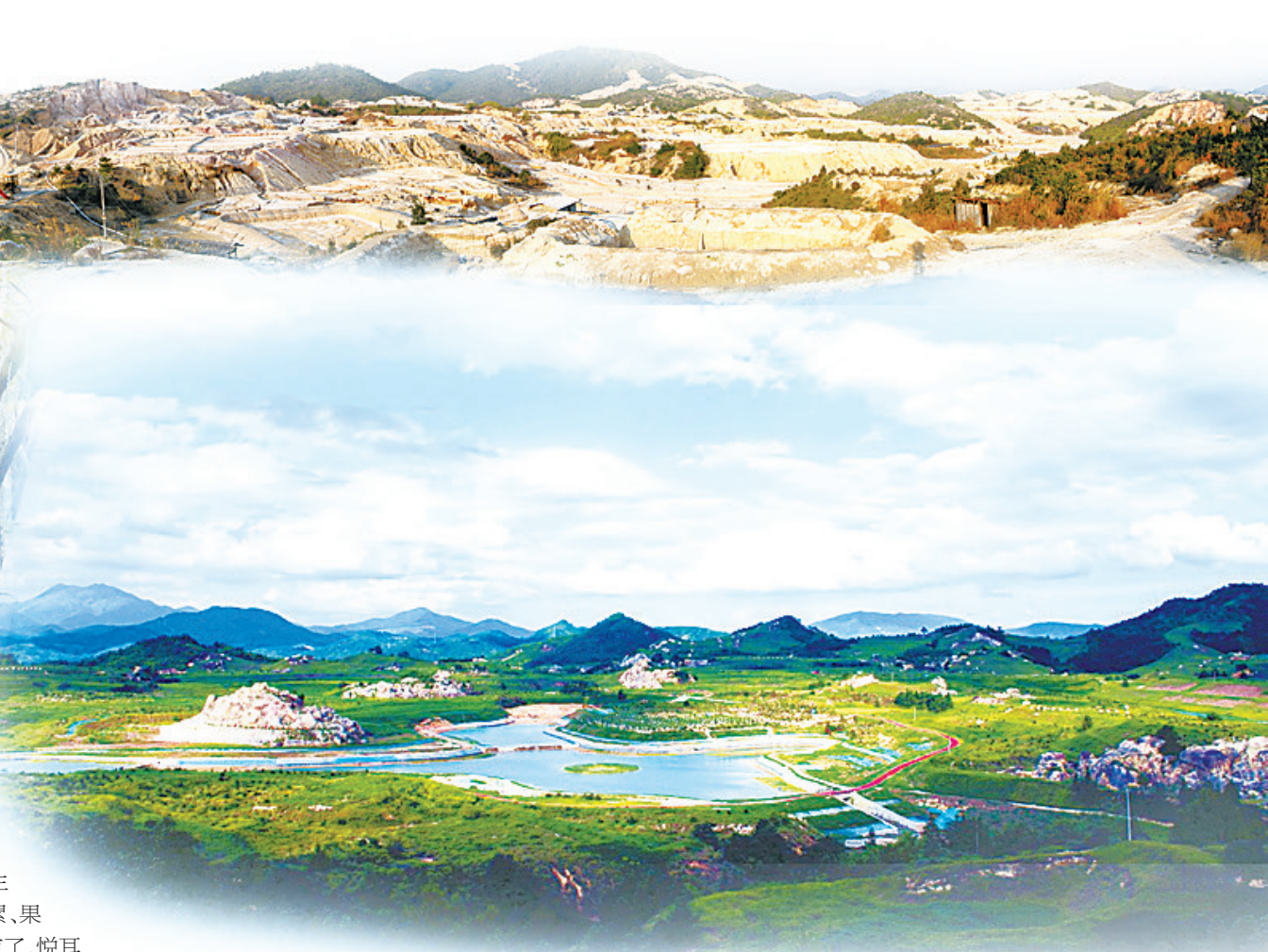
↑寻乌县文峰乡柯树塘废弃稀土矿区经过治理,成为人们喜爱的旅游观光地。