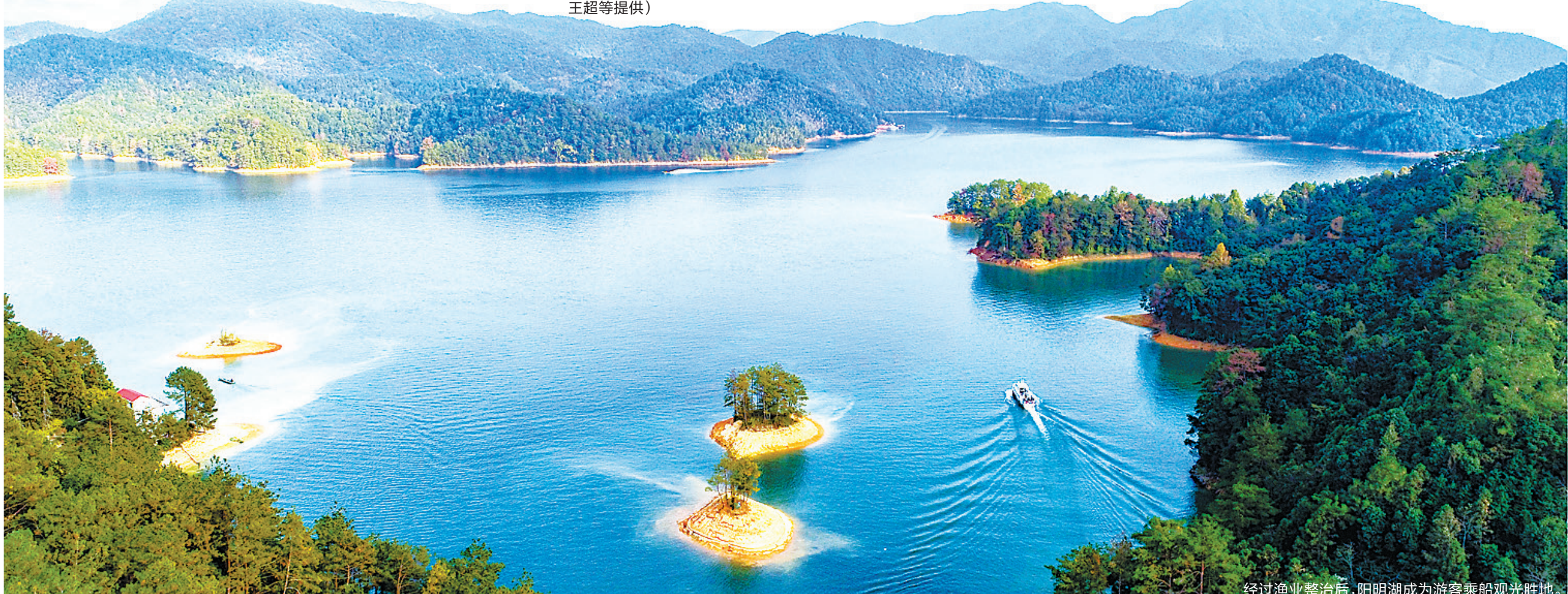
经过渔业整治后,阳明湖成为游客乘船观光胜地。