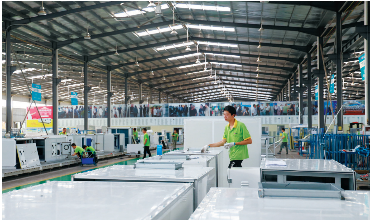
工人在江西浩金欧博环境科技有限公司生产车间内作业。

这是赣县区以科技创新助推企业转型升级的一个生动案例。近年来,赣县区紧紧扭住技术创新这个战略基点,多策并用激发创新活力,推动主导产业创新能力迅速提升,“稀金谷”成为全市产业创新的一片热土。该区引进了国家稀土功能材料创新中心等5个国字号科技创新平台,抓住“院士行”、赣州稀土论坛机遇,引进唐任远、顾国彪等6名中科院院士、工程院院士;支持企业与大