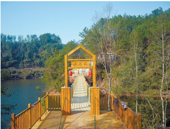
仙济岩乡村振兴示范点,当地群众感恩党委政府对当地事业发展的支持,自发筹资建设的感恩桥。