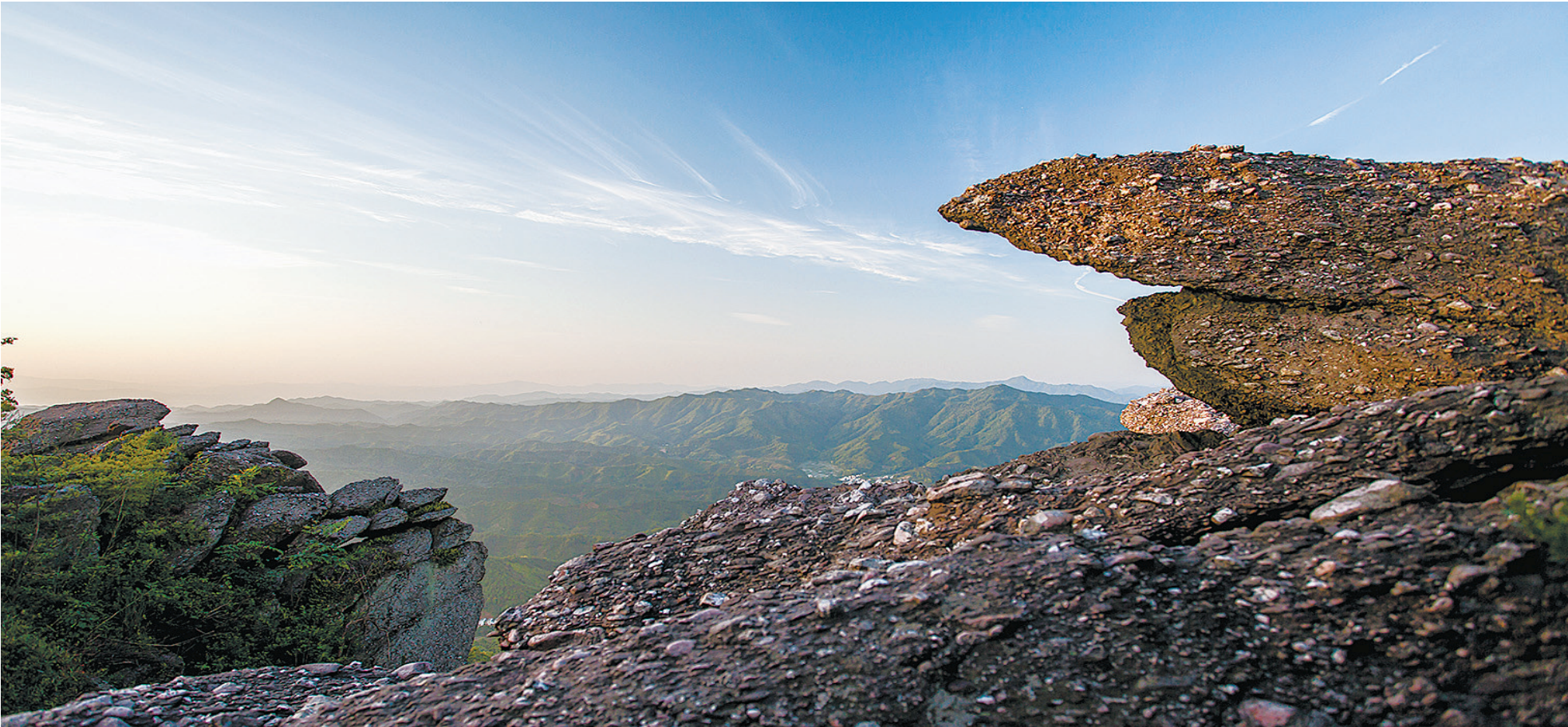
北江源头木公寨日出。

脱贫攻坚决战决胜 正平镇共有建档立卡贫困户1277户3768人,均已全部脱贫,其中2020年脱贫32户41人。顺利完成了市际交叉考核、国家第三方数据质量评估、省级专项调查等三项工作,产业、就业、教育、健康、住房保障、基础设施等十大扶贫工程取得重大进展,驻村工作队作用充分发挥,脱贫攻坚完美收官。瑞信等光伏扶贫基地成为全县样板;设立的球狮畲族村扶贫爱心超市成为全县示范;在全县率先推行干部夜校,切实提高了镇村干部和帮扶干部的脱贫攻坚能力;旅游扶贫成为脱贫攻坚新路子,球狮畲族村成为全县乃至全市及周边较有影响力的文化品牌,新打造了金丝皇菊特色产业,推动村级集体经济发展,20余户贫困户实现增收,户均增收6000元以上。