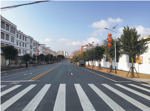
圩镇建设高起点规划设计,圩镇面貌焕然一新。