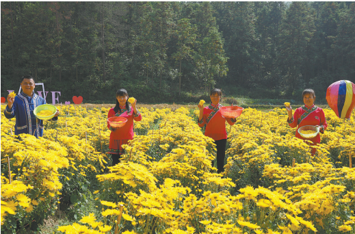
球狮畲族村金丝皇菊喜获丰收。