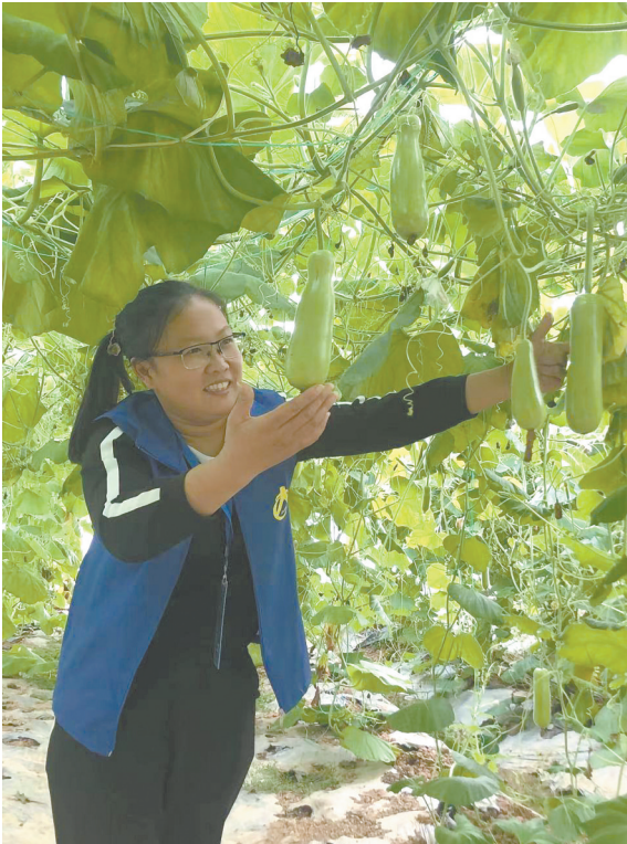
蔬菜产业成为村民致富的支柱产业。