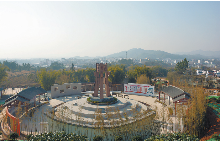
凝聚乡贤力量打造的白马寨健康文化公园成为群众健身休闲好去处。