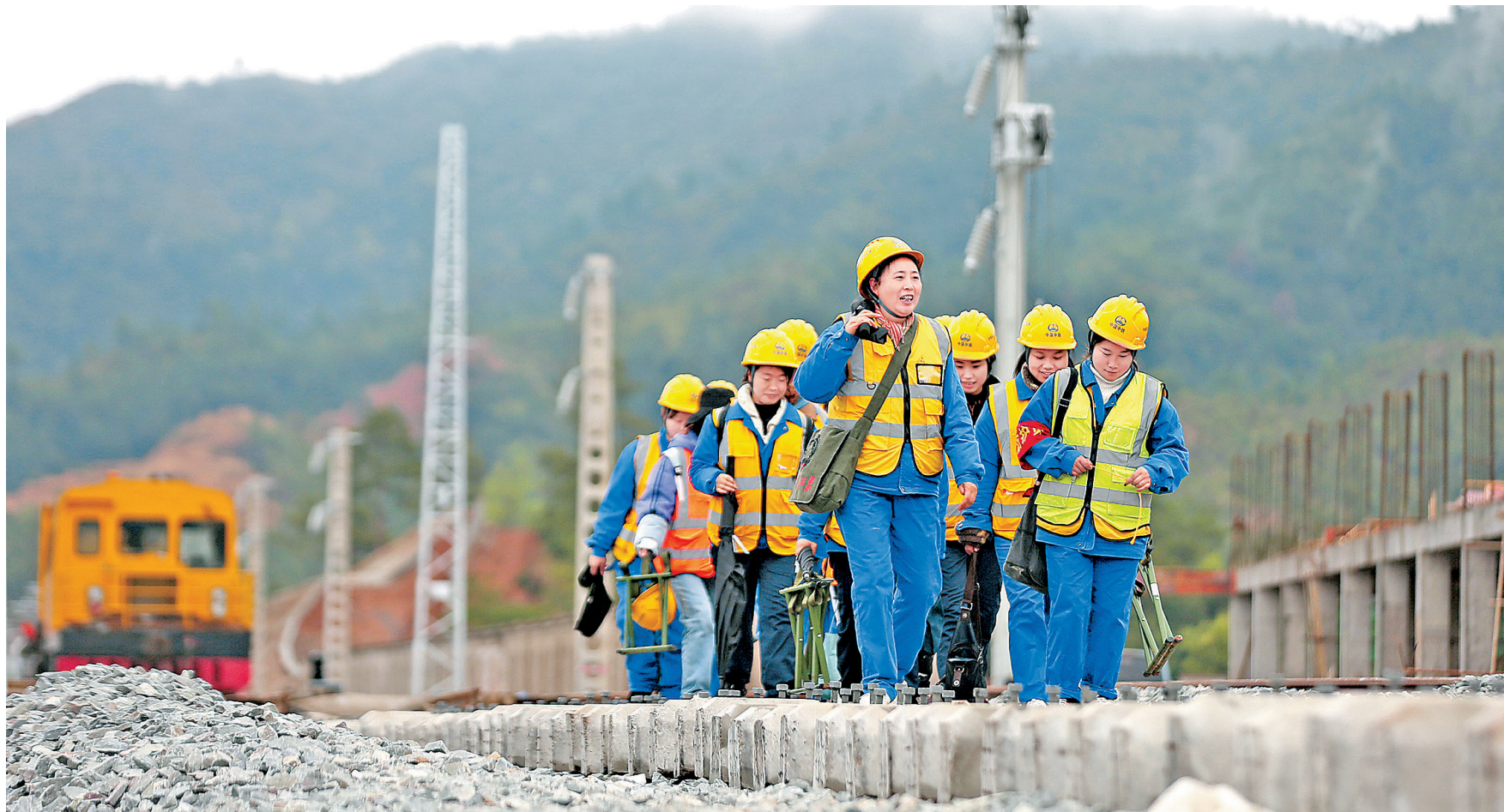
突击队员行走在道枕上。