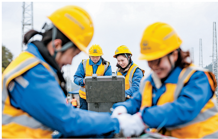
分线、穿线……动作流畅连贯。