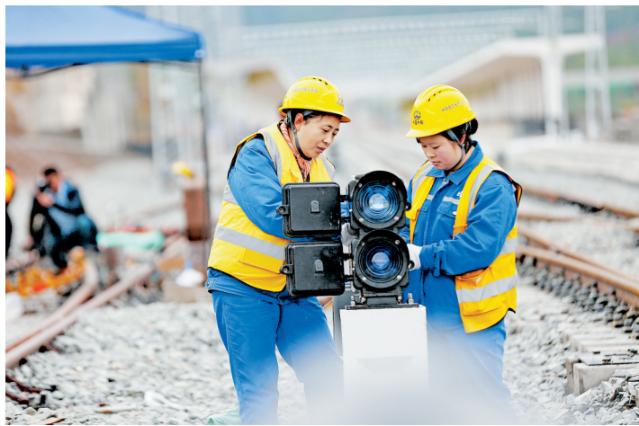
突击队员在进行信号灯配线作业。