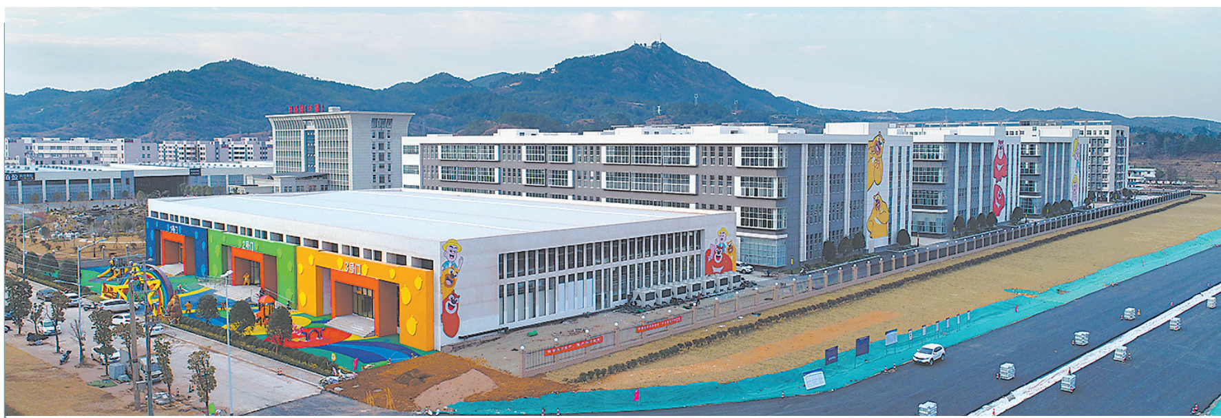
石城县鞋服产业园一角。