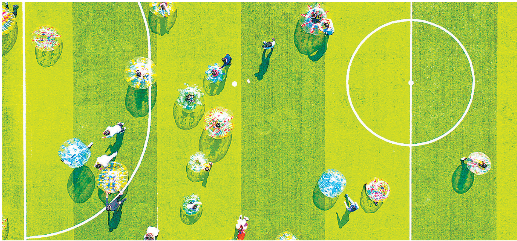
游客在罗坑村的足球运动场上体验碰碰球。