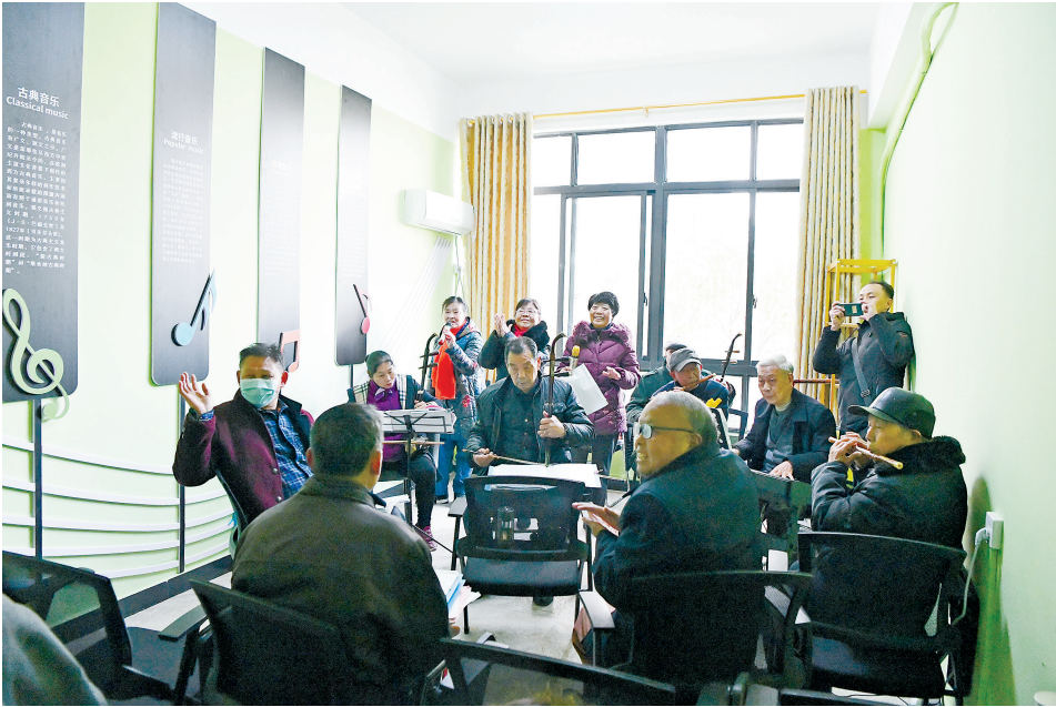
老人们在智慧养老服务平台休闲娱乐。

上犹县民政局大力推广以发布纪录片、书写寄语、网上祭扫等形式,缅怀先烈,寄托哀思,让爱在“云端”绵延。大力推广鲜花换纸钱、丝带祭哀思、植树缅怀、踏青遥祭等绿色文明祭扫方式,组织开展清明征文、经典朗诵等活动,丰富清明节日内涵,推动殡葬移风易俗。县殡葬管理所还组织免费代祭活动,组织人员对每座墓穴进行一次环境清理,擦拭一次墓碑,敬献一支鲜花。