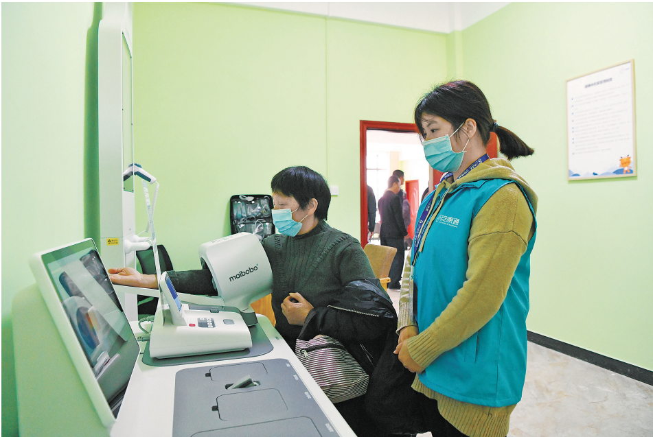
老人在居家养老服务中心接受健康体检。