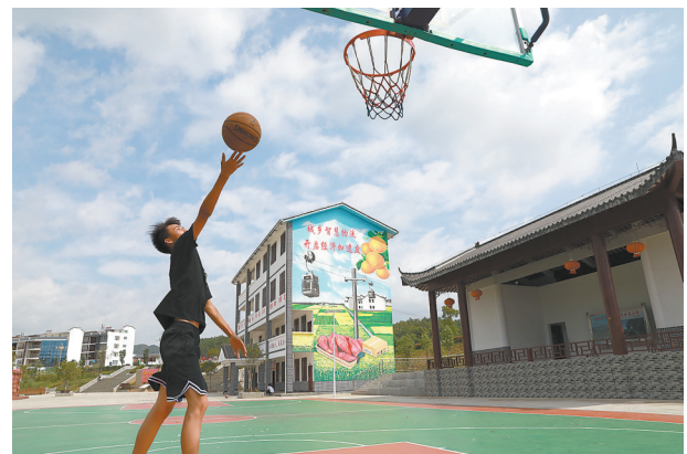
↑安远县鹤子镇阳佳村的村容村貌焕然一新,村民的精神文化生活更加丰富多彩。