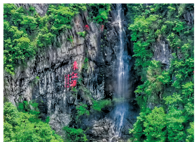
↑东江源头第一瀑。