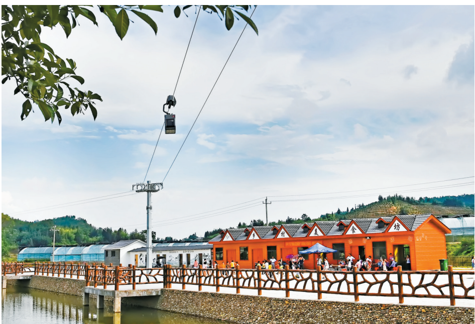
↑穿梭机器人在安远县鹤子镇阳佳村低空索道上运行,为农特产品飞出大山插上“电商翅膀”。