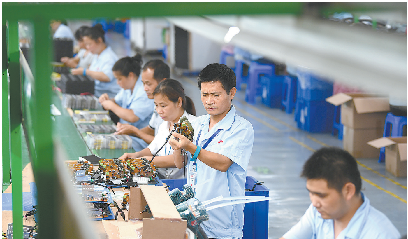
↑安远县得辉达公司生产车间,员工赶制出口订单。近年来,安远县主动对接“广佛肇”“深莞惠”经济圈电子信息领域,建设配套粤港澳大湾区先进装备制造和电子信息产业集群的重要基地和延伸带。