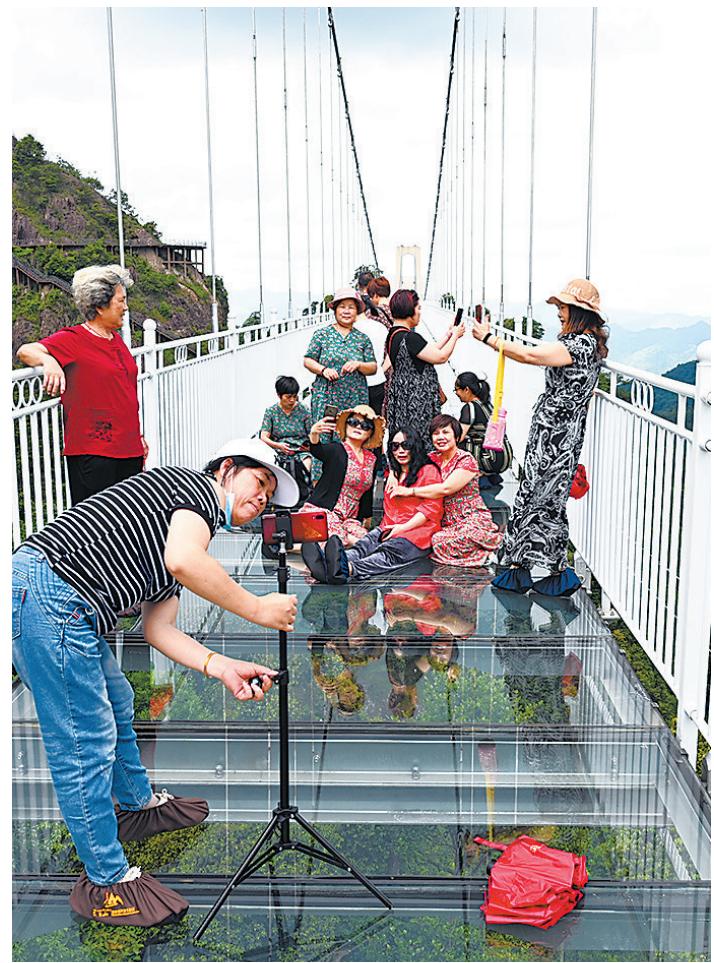
↑游客在三百山玻璃天桥拍照,留下美丽而惊险的一瞬。

现在,就让我们跟着摄影大咖们的镜头,来感受和品读东江源区人民保护绿色生态、发展绿色产业、共享绿色生活的鲜活瞬间吧。