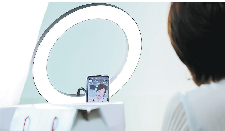
↑安远县鹤子镇农产品主播在介绍本地土特产。