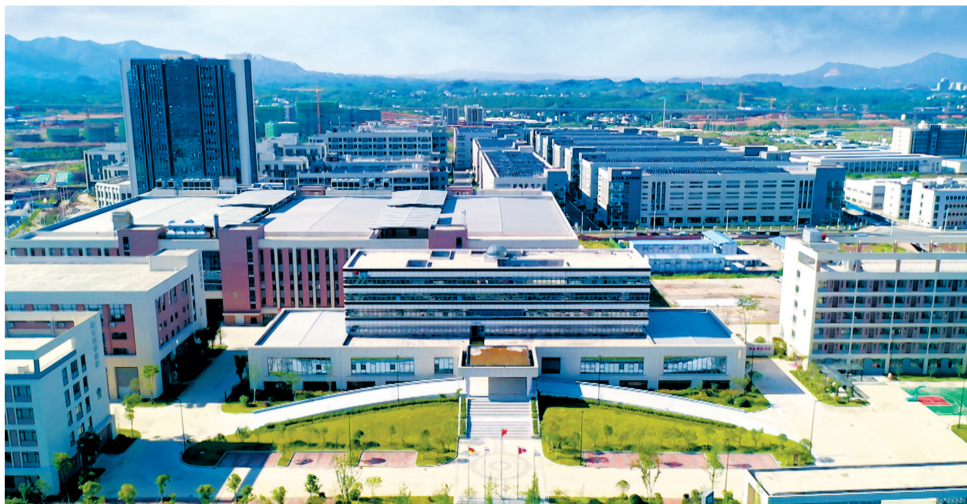
如今的赣州经开区标准厂房鳞次栉比,工业经济发展迅速。