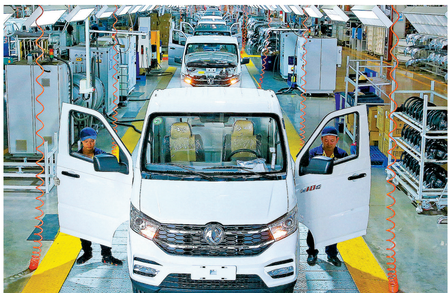
在国务院国资委的对口支援下,多个央企项目落户赣州经开区,为赣州经开区带来“国家动力”。图为凯马汽车生产线。