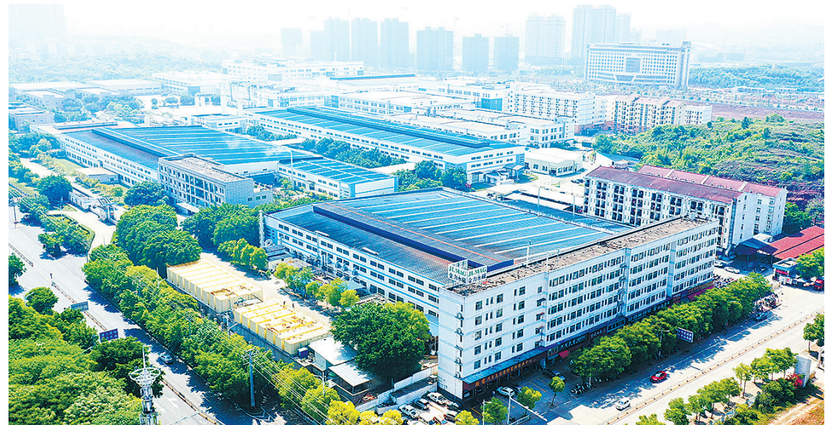
在工信部的对口支援下,赣州经开区多个项目列入国家工业强基工程项目、国家产业振兴和技术改造计划。图为金力永磁鸟瞰图。