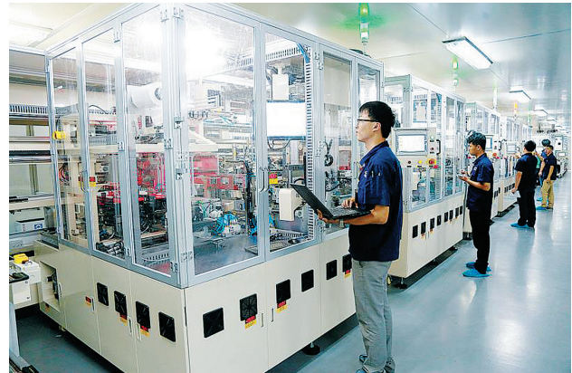
在国家部委的对口支援下,赣州经开区全力支持同兴达科技、孚能科技等企业靠大联强、做大做强。图为孚能科技车间。

在工信部的大力支持下,今年3月,国家工业信息安全发展研究中心江西分中心顺利落户赣州经开区。这个“国字号”平台,将打造成为全省促进数字经济健康发展、产业数字化转型的服务技术机构和高端智库。此外,金力永磁、澳克泰工具、睿宁新材、富尔特电子、山香药业入选国家工业强基工程项目、国家产业振兴和技术改造计划、工信部稀土开发利用综合试点产业技术成果转化及产业化项目等,共获得工信部各类扶持资金5.2亿元。在公安部的倾心帮扶下,赣州经开区脱贫攻坚和教育项目获得大量的资金支持,促