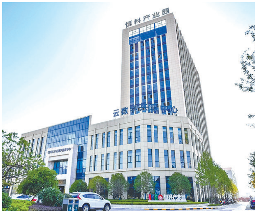
在赣州经开区,科技创新活力喷涌。图为恒科产业园。