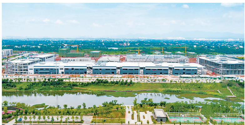
在国家部委的对口支援下,赣州新能源科技城内部道路四通八达,项目星罗棋布。图为吉利(赣州)42GWh动力电池项目工地。