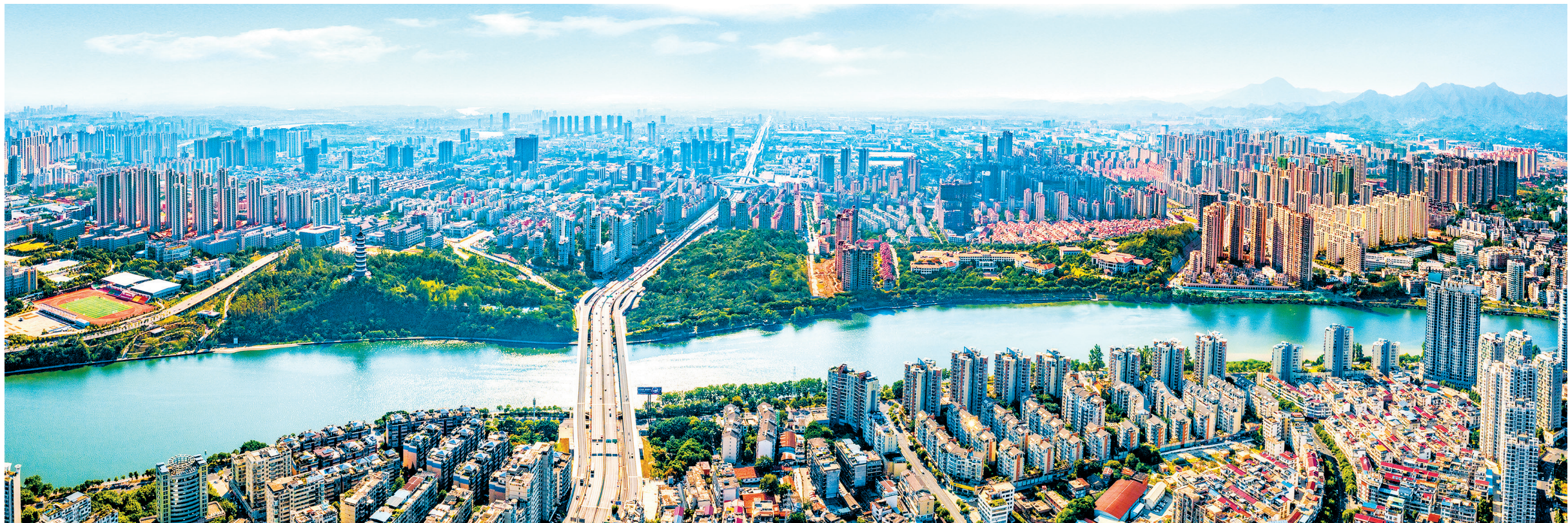
在国家部委的对口支援下,赣州经开区已成为一座风景秀美、交通便捷的产业新城。