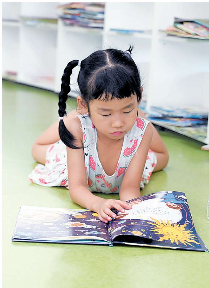
7月21日,小朋友在赣州市图书馆看书,遨游知识的海洋。