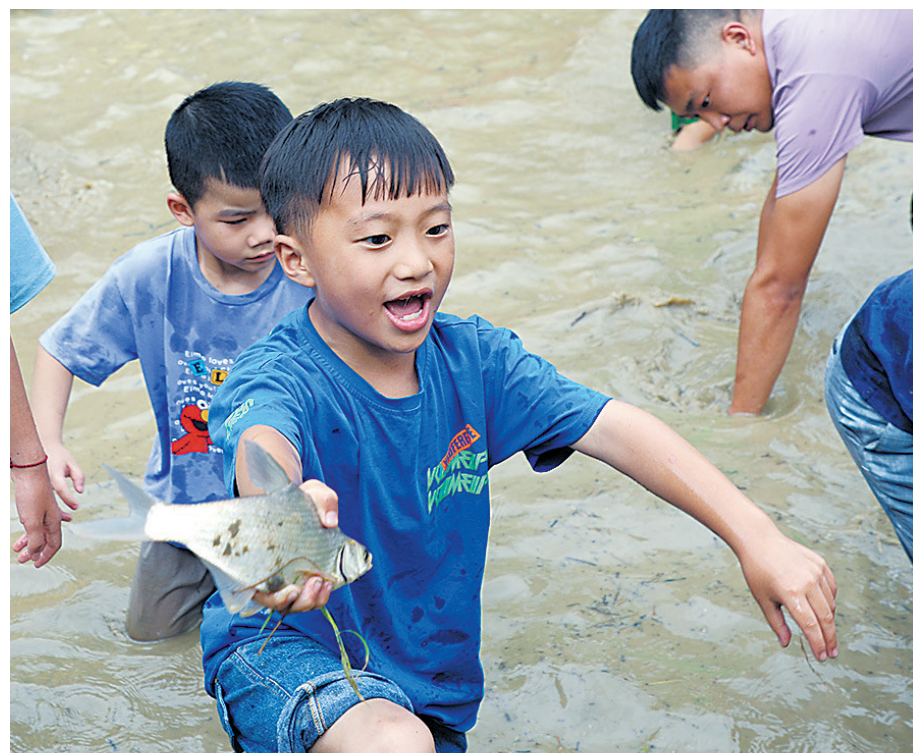
7月17日,小朋友在全南县金龙镇木金村参加摸鱼活动。