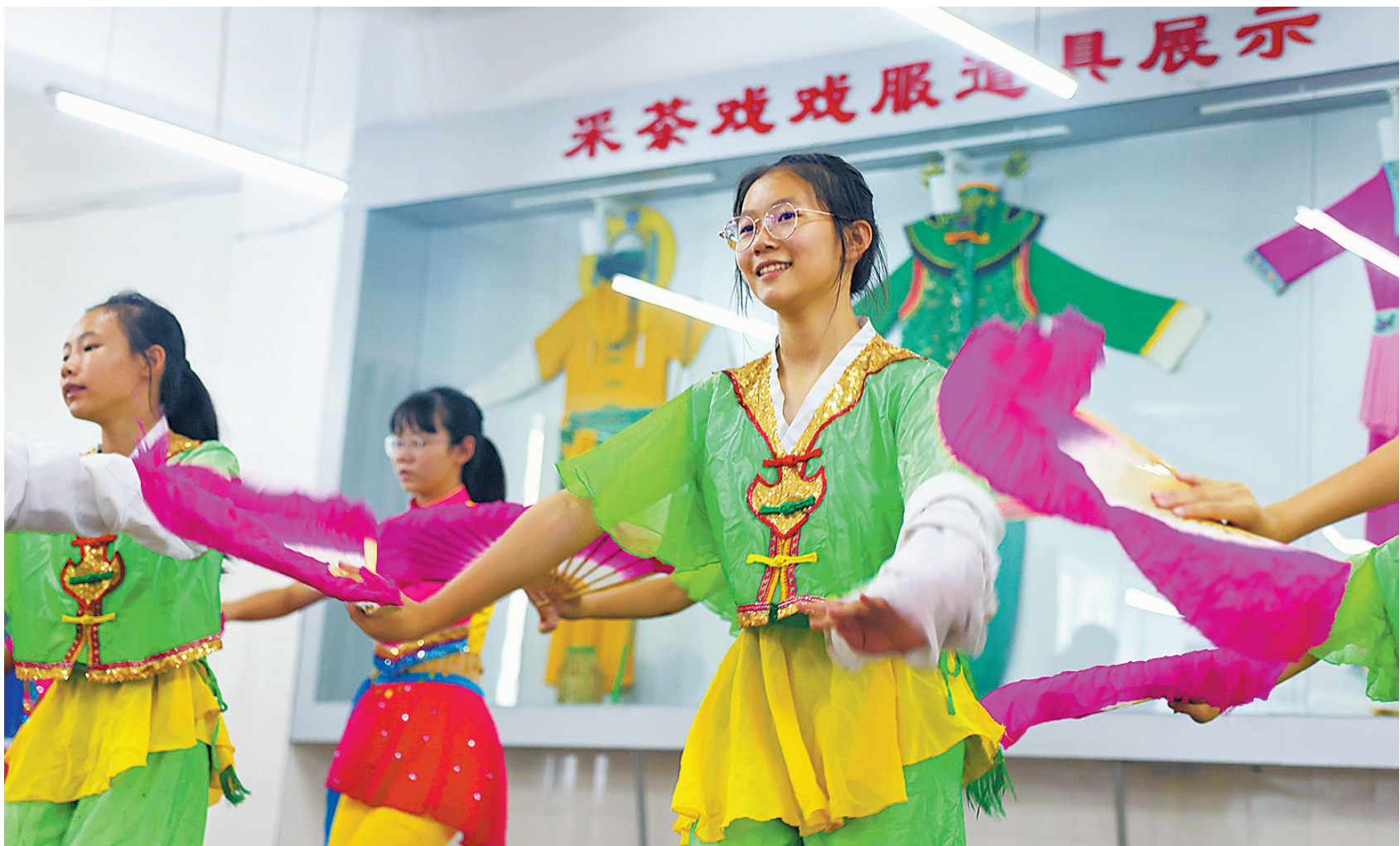
赣州市第五中学的学生在老师的指导下,学习赣南采茶戏,感受传统文化的魅力。赣州经开区各学校结合实际,开设了书法阅读、实验探究、创意机器人编程等课程,满足学生多样化学习需求,解决家长暑期“看护难”问题。