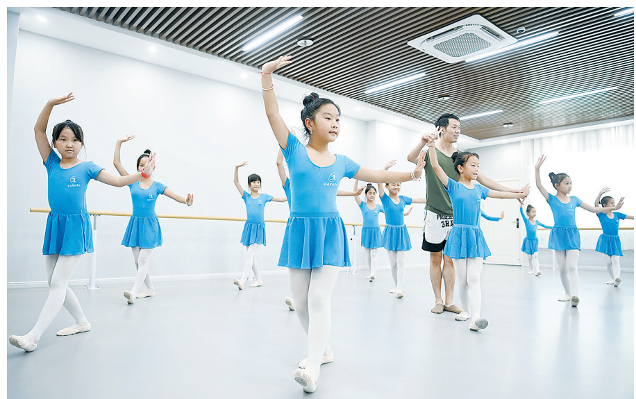
7月25日,小朋友们在一家舞蹈培训学校学习中国舞。暑假期间,宁都县的许多孩子参加各种舞蹈兴趣班,进行形体、舞蹈基本功等训练,丰富假期生活。