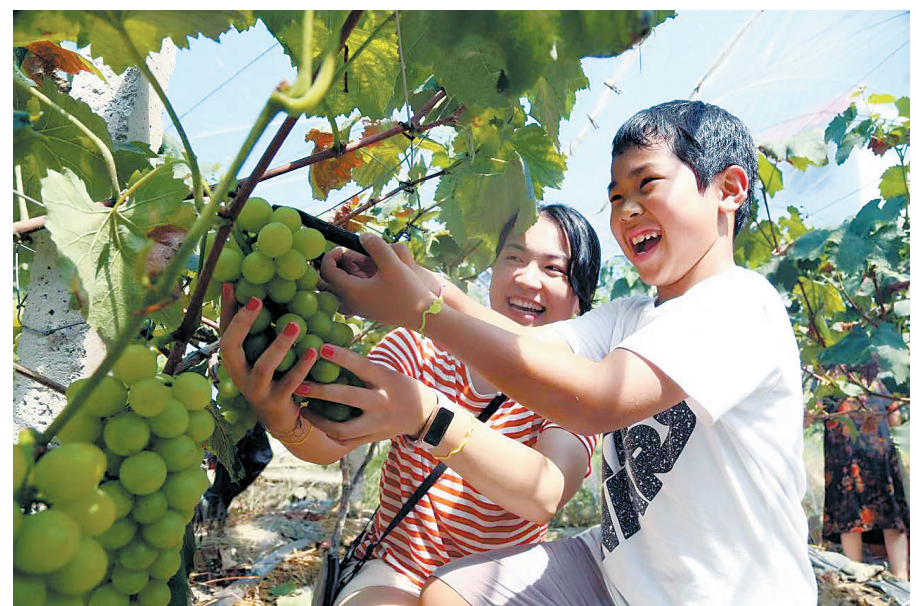
7月24日,石城县小松镇许坊采摘园里,小朋友在采摘葡萄,体验劳动的快乐和丰收的喜悦。