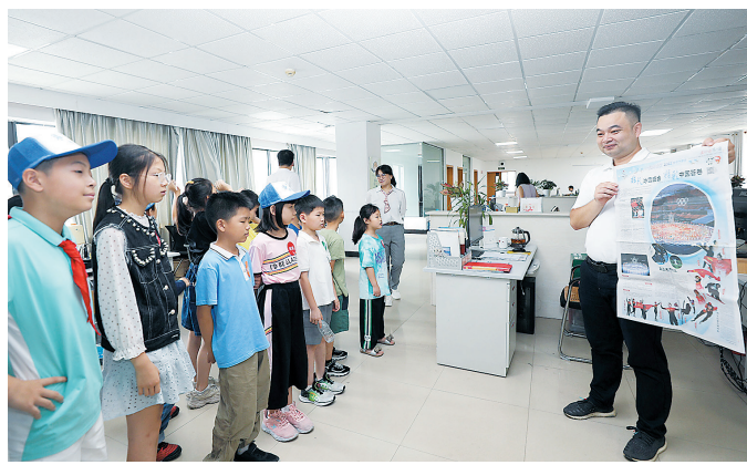
7月5日,参加赣南日报小记者夏令营的孩子们在赣南日报社了解报纸的出版流程。