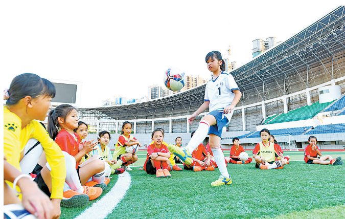
少女足球队员在干都县体育中心球场上训练。暑假期间,干都县足球训练营开营,各小学足球队在训练营组团进行足球技能训练。