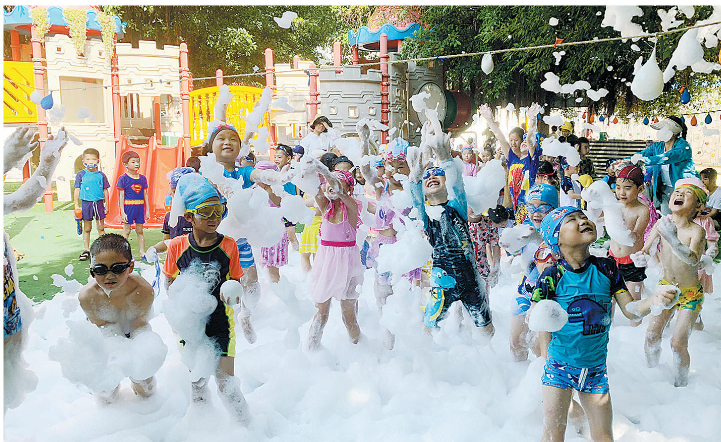
7月14日,章贡区文清幼儿园举办“泡泡趴”活动,小朋友们尽情享受夏季的欢乐和清凉。