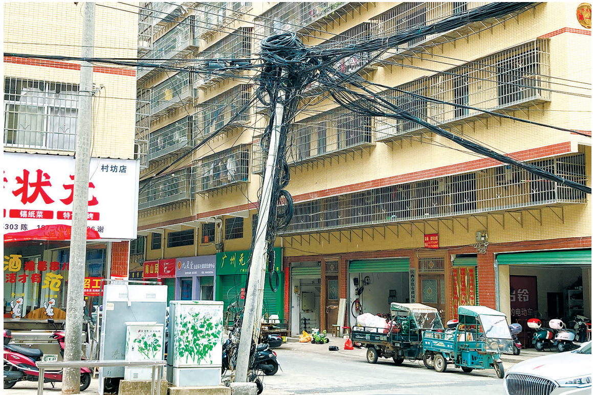
在南康区幸福小区，一根线杆被扎堆的线缆压得有些倾斜。