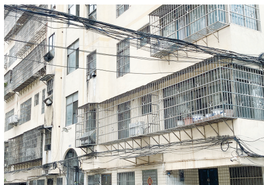
在南康区金赣小区，数扎线缆从楼下拉到楼上。