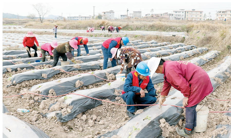
近日，国网赣州宁都县供电公司党员服务队队员在田头镇边斜村指导村民春耕春灌生产安全用电。