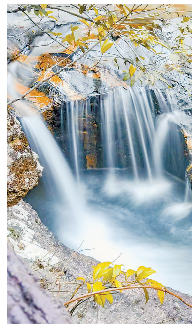
↑韩坊镇宝莲山瀑布潺潺。