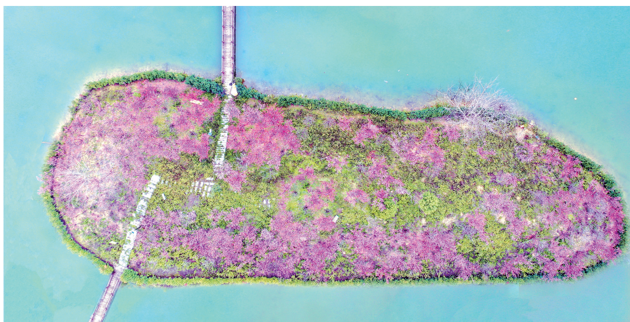
↑梅林古镇梅花盛开。