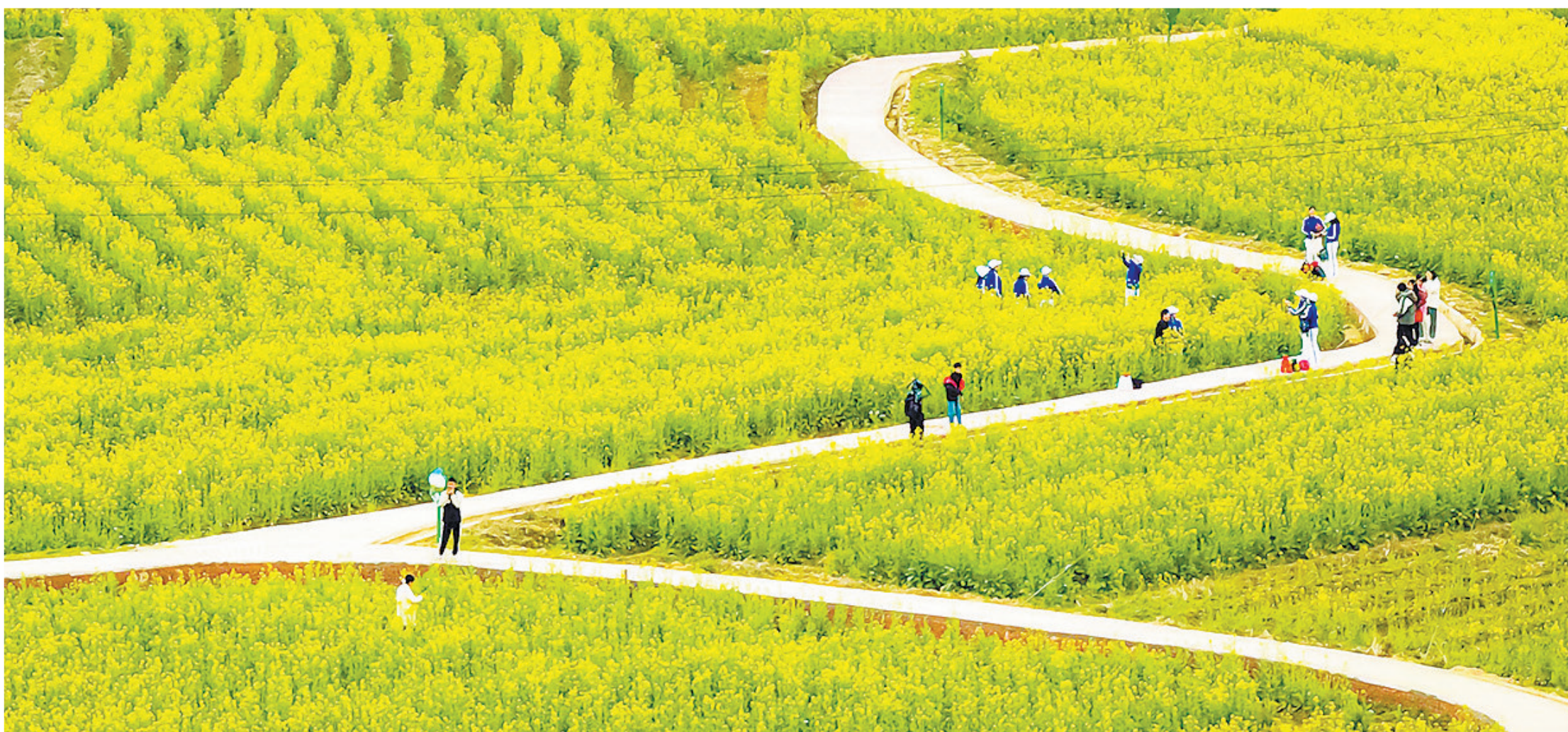
↑南塘镇船埠村油菜花航拍图。