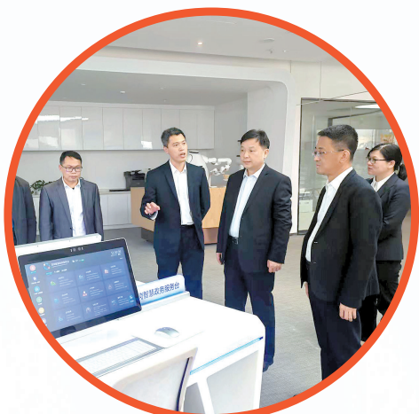
寻乌考察团赴深圳对接工作。