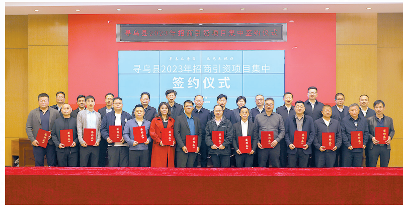
2月20日,寻乌县举行2023年招商引智项目集中签约仪式,此次共签约14个招商引智项目,签约金额达122.3亿元,涵盖了新能源、新材料、文教旅游、农产品深加工等领域。

通过调动一切可调动资源,凝聚一切可凝聚力量,寻乌持续招大引强,2022年全年签约项目49个,总额319.45亿元,引进项目数量之多、投资之大、质量之高均为历史之最,充分实现了推动招引“白热化”,拼出发展“满堂红”。