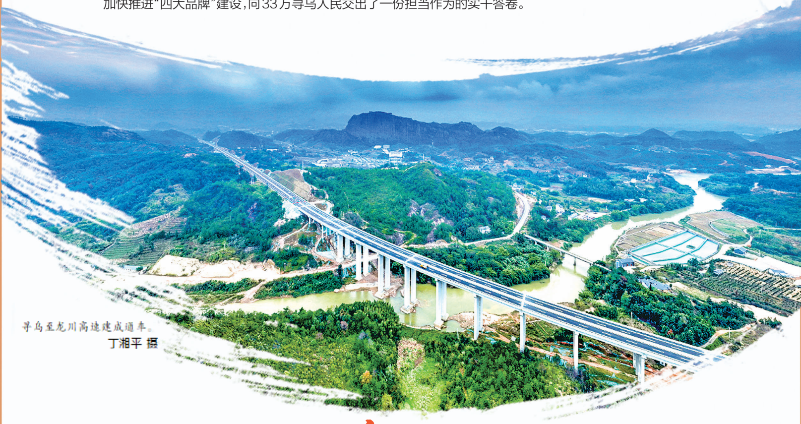
寻乌至龙川高速建成通车

挺膺担当促发展,图其至远谋新篇。2022年是党的二十大召开之年,也是寻乌发展进程中极不寻常、极不平凡的一年。寻乌县委、县政府紧扣学习宣传贯彻党的二十大精神主线,深入实施“三大战略、八大行动”,加快推进“四大品牌”建设,向33万寻乌人民交出了一份担当作为的实干答卷。