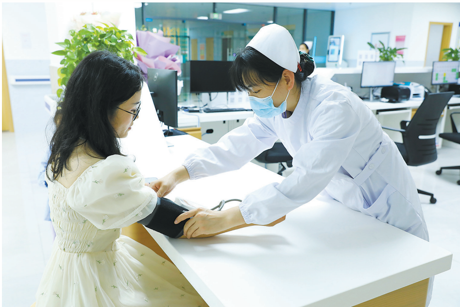
医护人员在为市民测量血压。