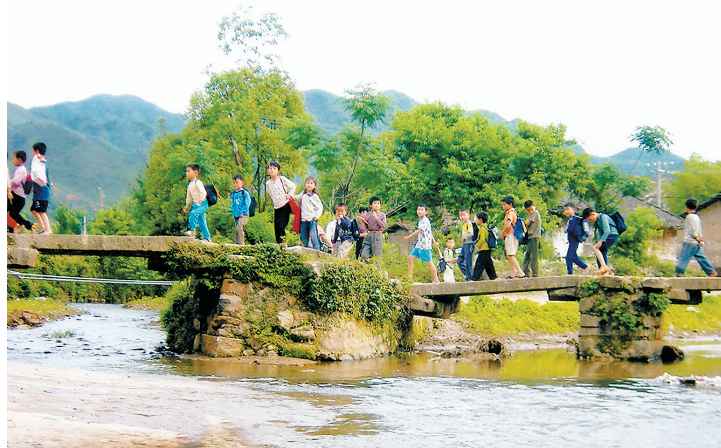
横贯三僚的阴阳溪流。