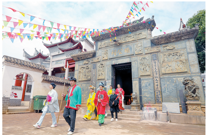
三僚村民每年请戏班唱“杨公戏”，都要先拜杨公祠。