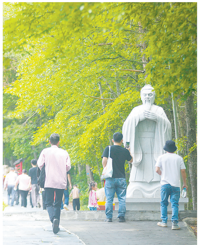
如今的三僚，已成为一个特色文旅景点。