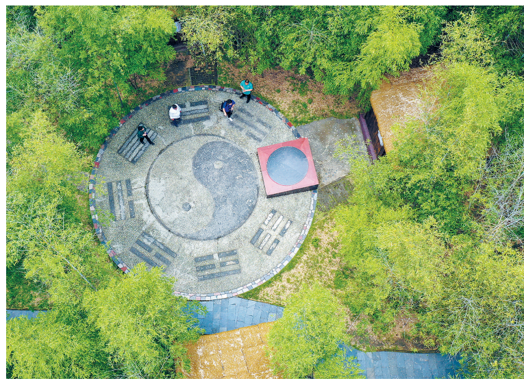
三僚的太极八卦小游园。

如今，三僚村充分利用传世堪輿文化，结合用好历史文化名人、自然山水风光等资源，全力打造历史文化名村，正以崭新的面貌，迎接海内外游客的纷至沓来。