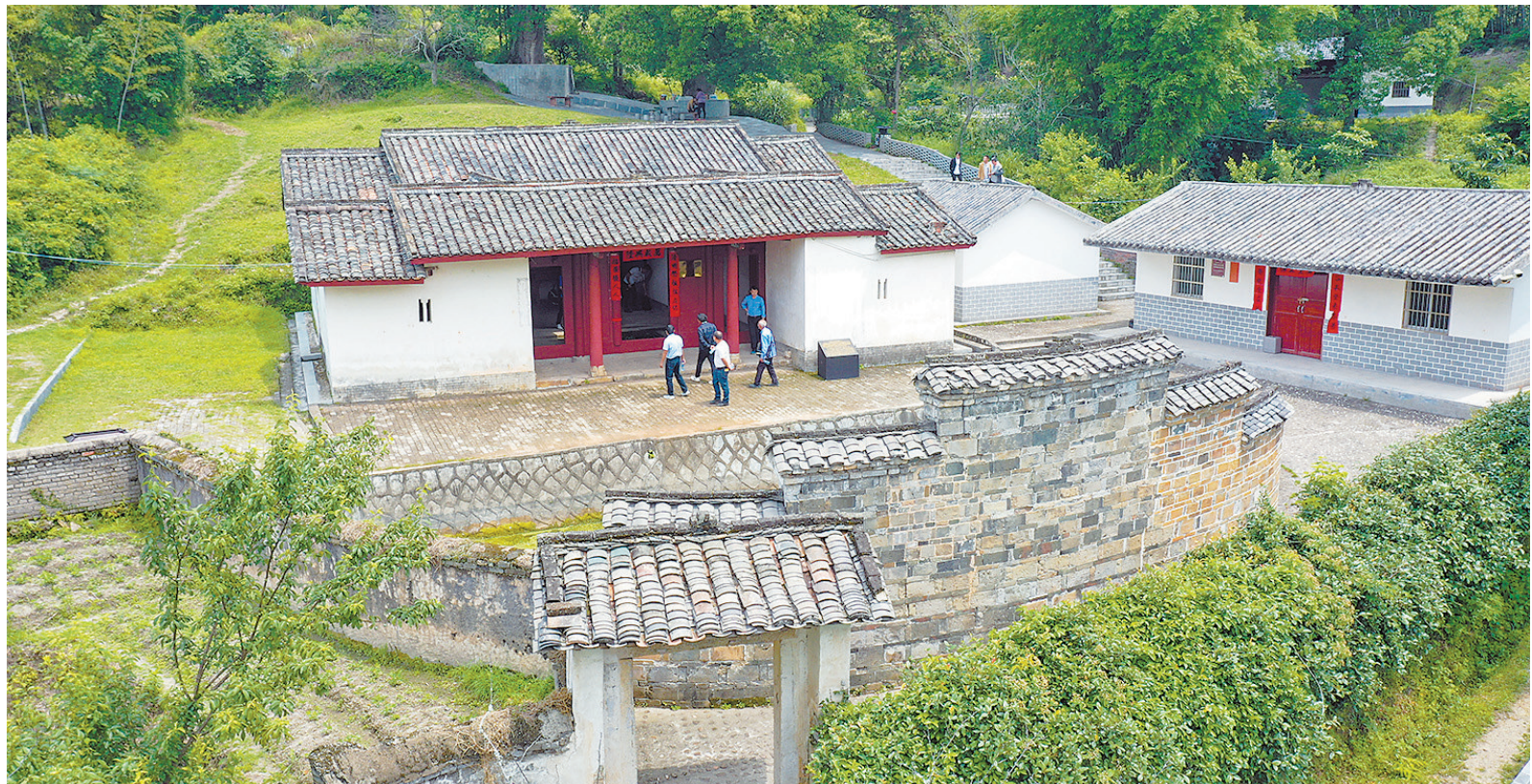
三僚村的蛇形村（承志堂）依山势而建，颇有讲究。