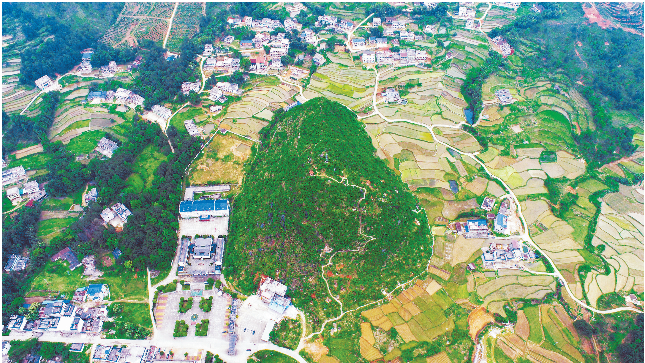
位于三僚村中央的“罗经石”，形如罗盘中的指南针。