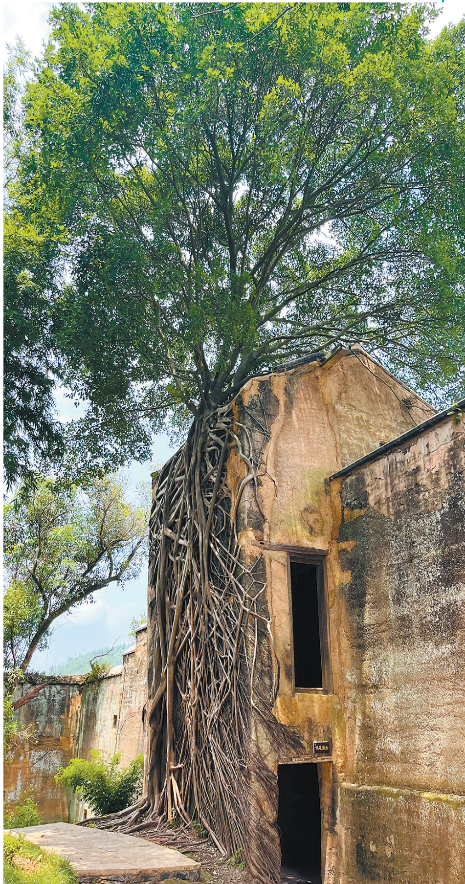
沛东八景之一“苍榕恋墙”。

徜徉在生态优美、红色铸魂、绿色赋能、文旅融合的沛东古村，魅力沛东绽放出独特的“古绿红”色彩。凝望着古樟古榕，古村的多情乡愁、古风古韵、厚重人文际天而来，缕缕不绝……生态宜居的自然环境、原汁原味的农耕生活着实令人神往。栖息其间，远离喧嚣的世事纷扰，如梭的光阴不知不觉会让你放慢脚步。