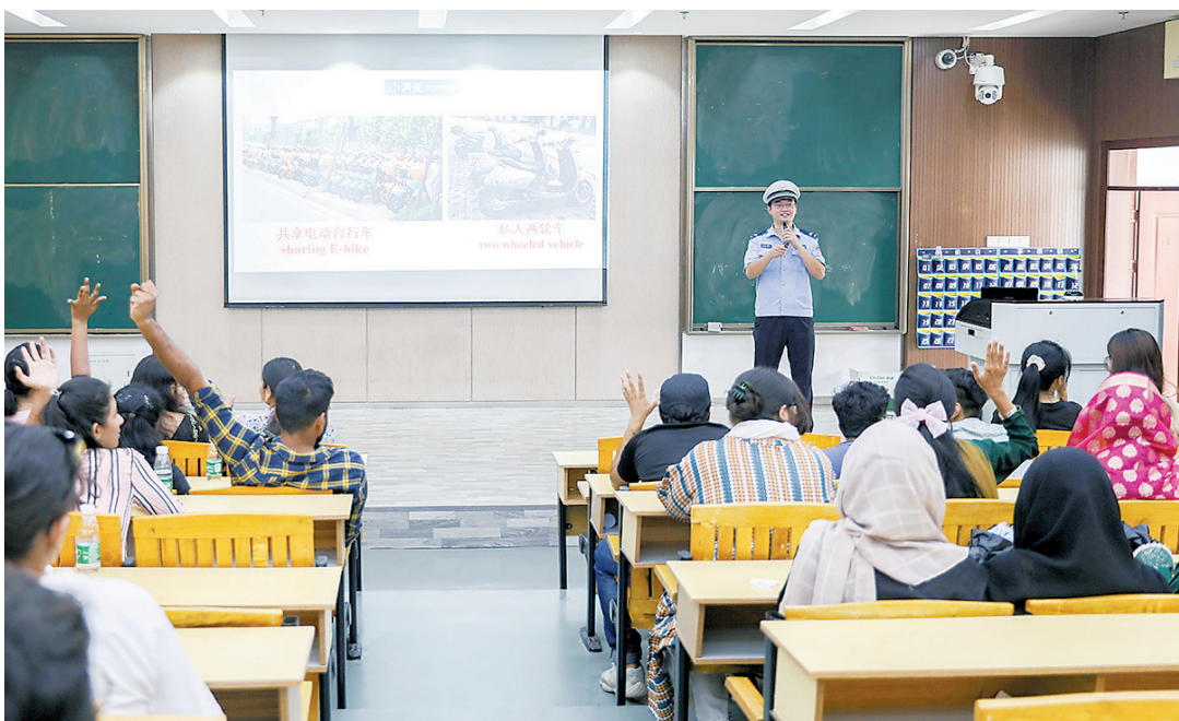
近日,赣州经开区交警大队走进赣南医学院,专门为该校留学生开展交通安全宣传交流活动,详细讲解交通安全知识,通过理论与实践相结合的方式,增强留学生的安全文明出行意识。

座谈会前,蟠龙镇村干部与畲族群众代表共同参观了镇级民族团结一家亲工作站。会上,大家结合自身的工作、生活实际,围绕蟠龙镇建设建言献策。畲族群众代表深入周边居民小区发放“民族团结一家亲”宣传资料。会议希望发挥好少数民族代表的积极作用,引导少数民族群众积极投身于民族团结建设,不断铸牢中华民族共同体意识。