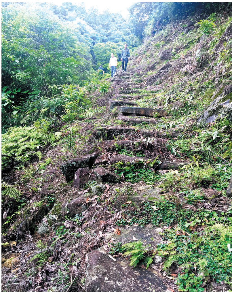
昔日赣湘往来的交通要道——江西门古道。