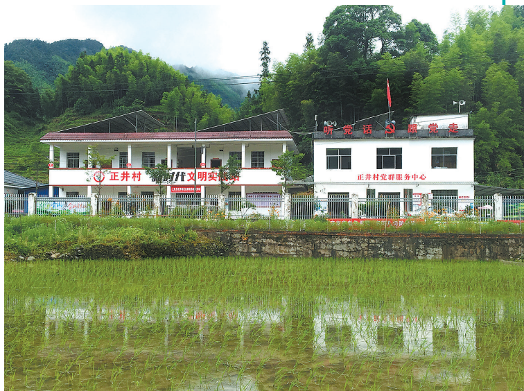
山水画中的正井村。