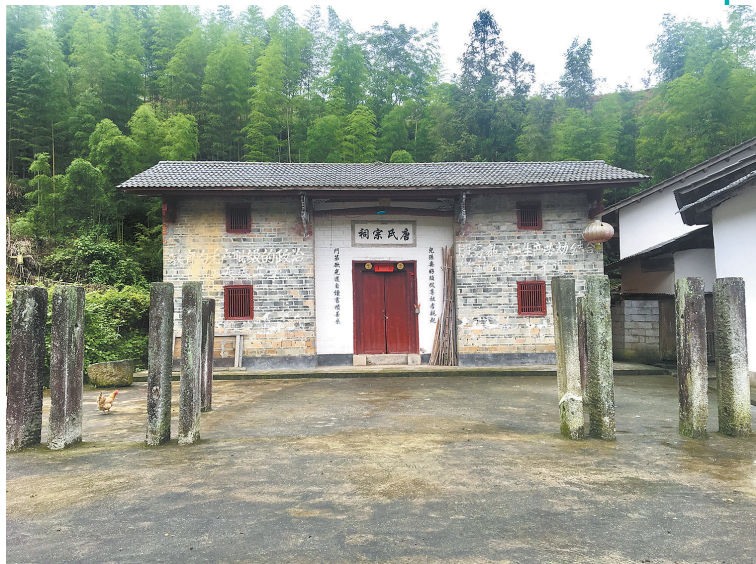
正井村里的唐氏祠堂。

一阵山雨过后，盈盈云水间，这极为壮美的景象，令我们心旷神怡。这里是康养休闲避暑的好去处。这里，适合入梦。