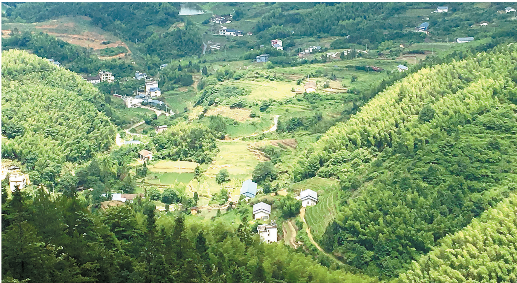
风光秀丽、景色宜人的正井村。