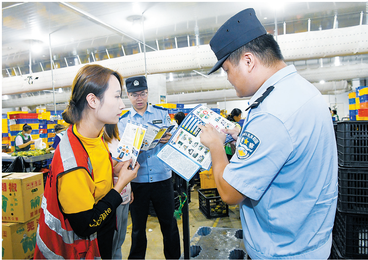
9月6日,赣州市公安局开发区分局综合保税区派出所联合保税义警在顺丰丰泰产业园向企业员工宣传反诈防骗知识。连日来,该派出所深入辖区企业,开展反诈宣传活动,集众人之力共同防范电信诈骗,推进“无诈厂区”“无诈车间”创建,切实守住企业员工的钱袋子。

执法人员先后来到农贸市场、大型商超的肉铺、卤制品铺、水果铺、生鲜柜台,查看商户是否使用“生鲜灯”,并详细记录使用“生鲜灯”的商户照明设施是否自主安装,是否出于“美颜”目的对照明设施进行挑选、是否清楚市场监管局出台的新规等。执法人员还在同一时段对“生鲜灯”下和未使用“生鲜灯”的猪肉进行对比,发现猪肉在自然光下呈淡粉色,在“生鲜灯”照射下明显增亮增红,“生鲜灯”灯光下难以分辨肉类的新鲜程度。为此,全南县市场监督管理局提示广大消费者,一定要仔细分辨食用农产品真实质量,避免被“生鲜灯”误导。