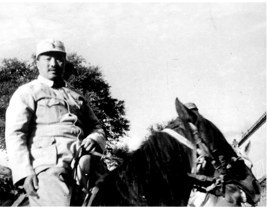
抗战时期的贺龙。(资料图片)

贺龙元帅每每在最艰苦、最危险的时刻总是挺身而出,他说:“因为我是个共产党员,还怕困难吗?”然而,贺龙为了让自己成为一名正式共产党员,却经历了数十次的苦苦追求。1951年贺龙曾对一位同志说过:“有的材料写着我70次找党,算上历次的要求,我也记不清了,没有70次,恐怕也有几十次吧。”