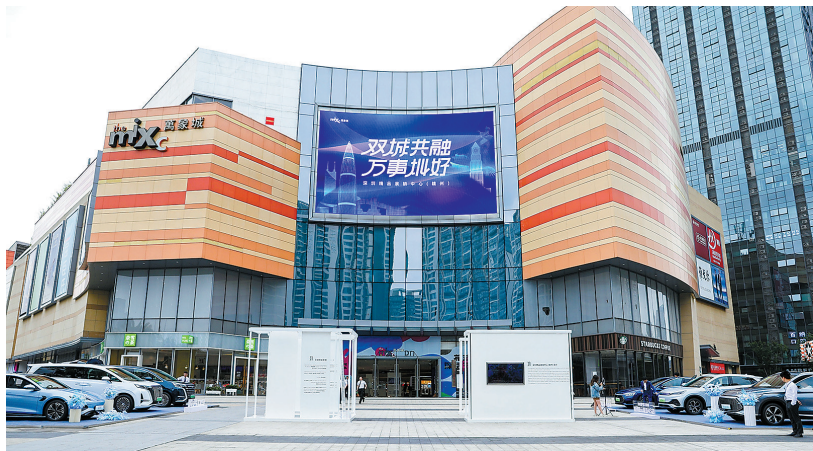
5月7日,深圳精品展销中心(赣州)在章贡区万象城揭牌运营。(资料图片)

为积极融入粤港澳大湾区,打造产业协同高地,章贡区充分发挥自身区位优势、产业优势及比较优势,系统优化产业结构,主动承接大湾区产业转移,积极引进产业项目,大力培育产业龙头,着力完善产业链条,加速推进产业集聚,着力构建特色鲜明、优势突出的现代产业体系,为高质量发展夯