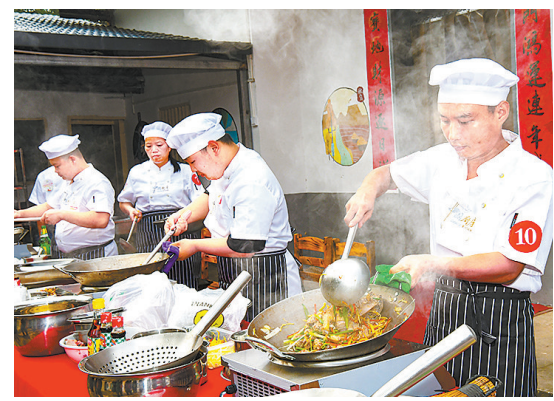
9月28日,厨师在章贡区水西镇“乡厨”争霸赛上制作菜品。当日,水西镇举行首届“乡厨”争霸赛,以进一步挖掘当地美食文化和讲好美食故事,推进和美乡村建设。