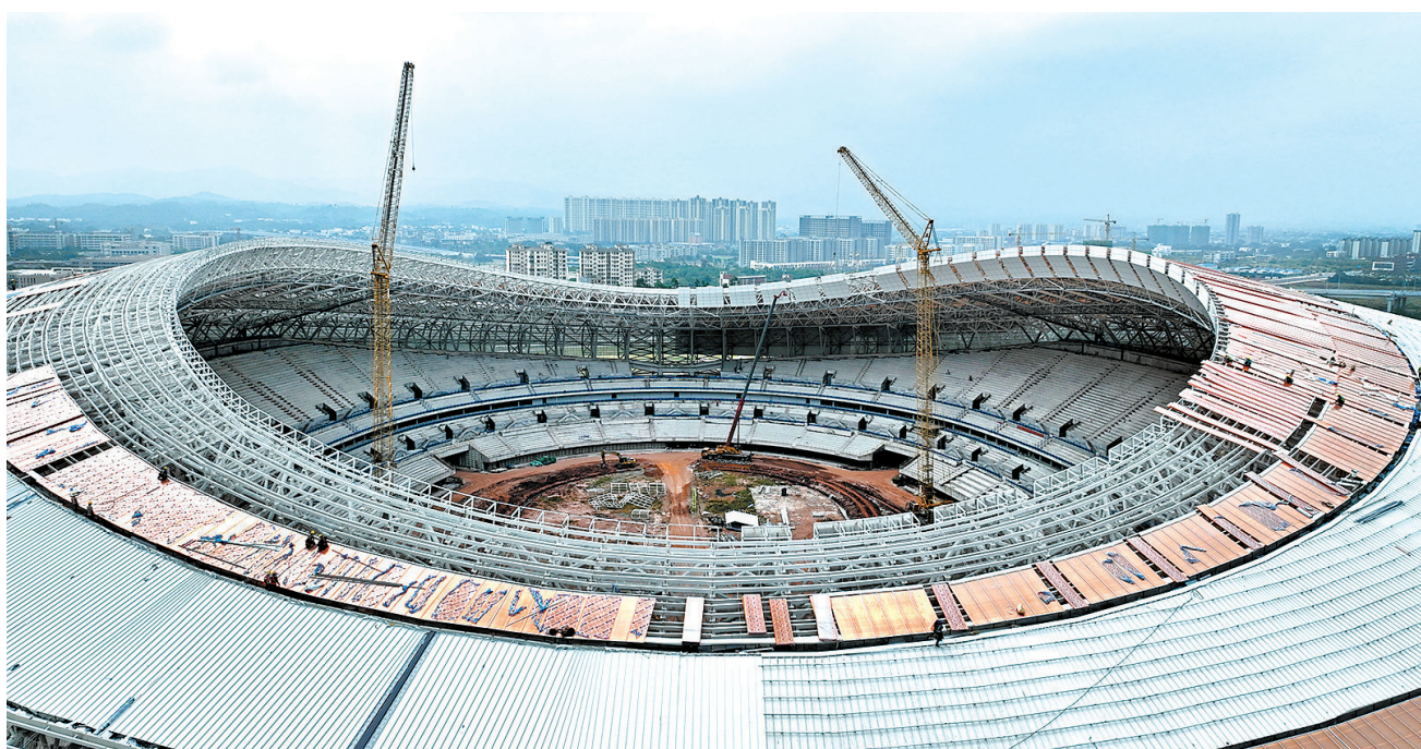
9月29日中秋节当天,赣州市全民健身中心(一期)项目建设现场,工人为“鸟巢”装修屋顶。中秋、国庆期间,赣州城投集团组织施工建设的赣州市全民健身中心(一期)、中国科学院赣江创新研究院人才小区、赣南大道快速路三标和四标、崇义县城乡污水处理厂网一体化PPP等近40个重大项目不停工,8000余名参建人员在确保质量和安全的前提下,加快推进项目建设进度。

引更多好项目。高位示范带动。中秋、国庆期间,市厅级以上领导带头深入挂点联系项目一线,开展走访慰问活动,督导项目单位做好安全生产工作,协调解决项目建设节点难点问题。市县两级四套班子领导带头深入不停工项目和不停产企业,及时协调解决各种困难和问题,指导各地加快推动项目建设,用心用情用力帮助重点企业加足马力生产。各地各部门紧盯粤港澳大湾区、长