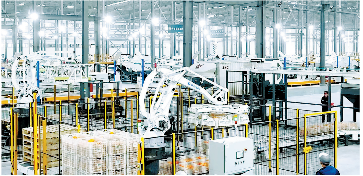
中科微至数字化生产线在全速运转。