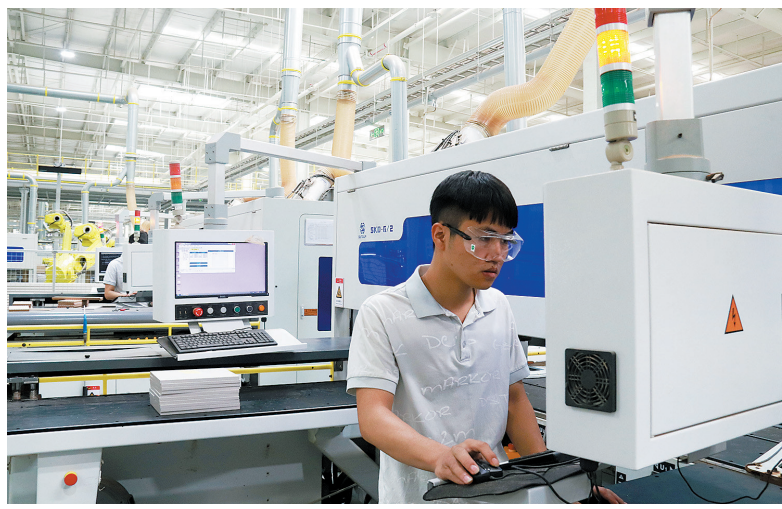
工人在美克美家数制生产线上操作。