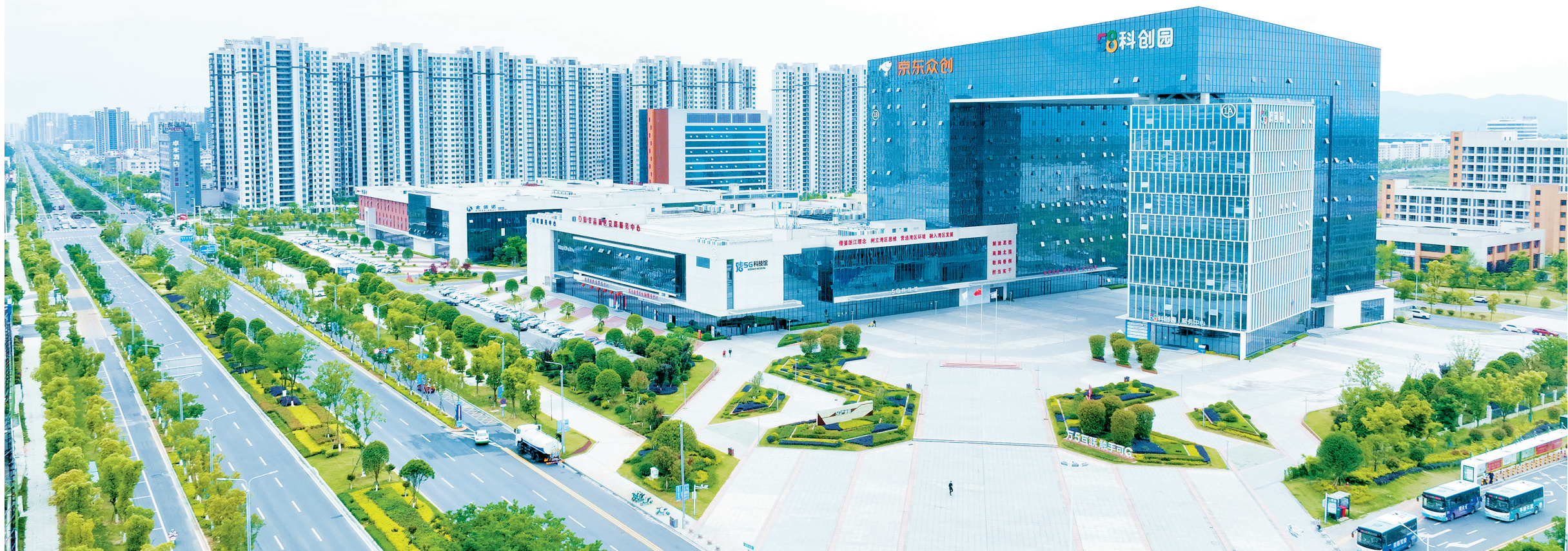
信丰县5G产业园全景。