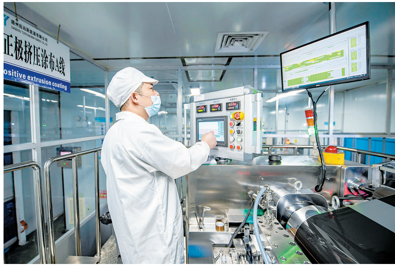
赣州新拓能源公司内,工人正在进行正极挤压涂布工序。