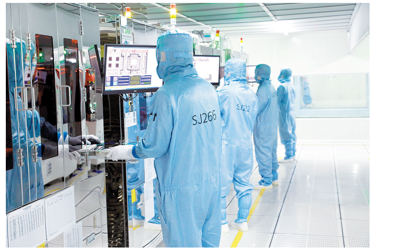
信丰世嘉科技有限公司车间,工人在操作LA组装机。