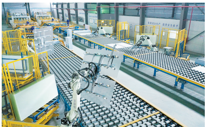
江西赣悦新材料有限公司智能生产车间,自动化生产线上在生产光伏玻璃。