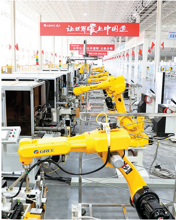
格力南康工厂空调自动化生产设备正在运行。