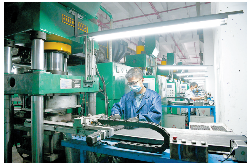
工人在赣州天磁科技有限公司生产车间有序作业。