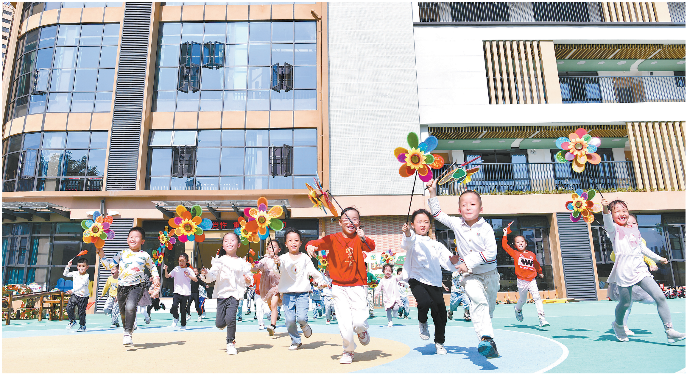
小朋友在新建成的章贡区第十九保育院体验“童趣欢畅”课程。我市不断扩充教育资源,加快推进校园建设,扩大学位供给,着力解决入园难、入学难问题。