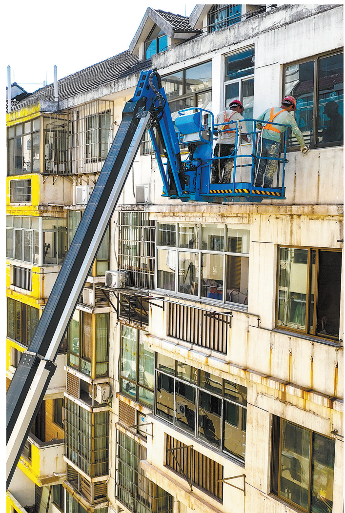
今年7月,章贡区解放街道洪城巷片区入选全国完整社区建设试点名单,该片区将改造楼栋46栋,惠及1236户居民,进一步改善居民的居住环境。图为工人在该片区粉刷外墙。

衣食住行、柴米油盐、就业养老、医疗教育……民生无小事,事事皆关情。随着主题教育深入开展,我市各地各单位将持续聚焦群众急难愁盼问题,落实“民呼我为”“接诉即办”,努力将问题清单转化为成效清单,把惠民生、暖民心、顺民意的工作做到群众心坎上,让老百姓的日子越过越和美、越过越幸福。