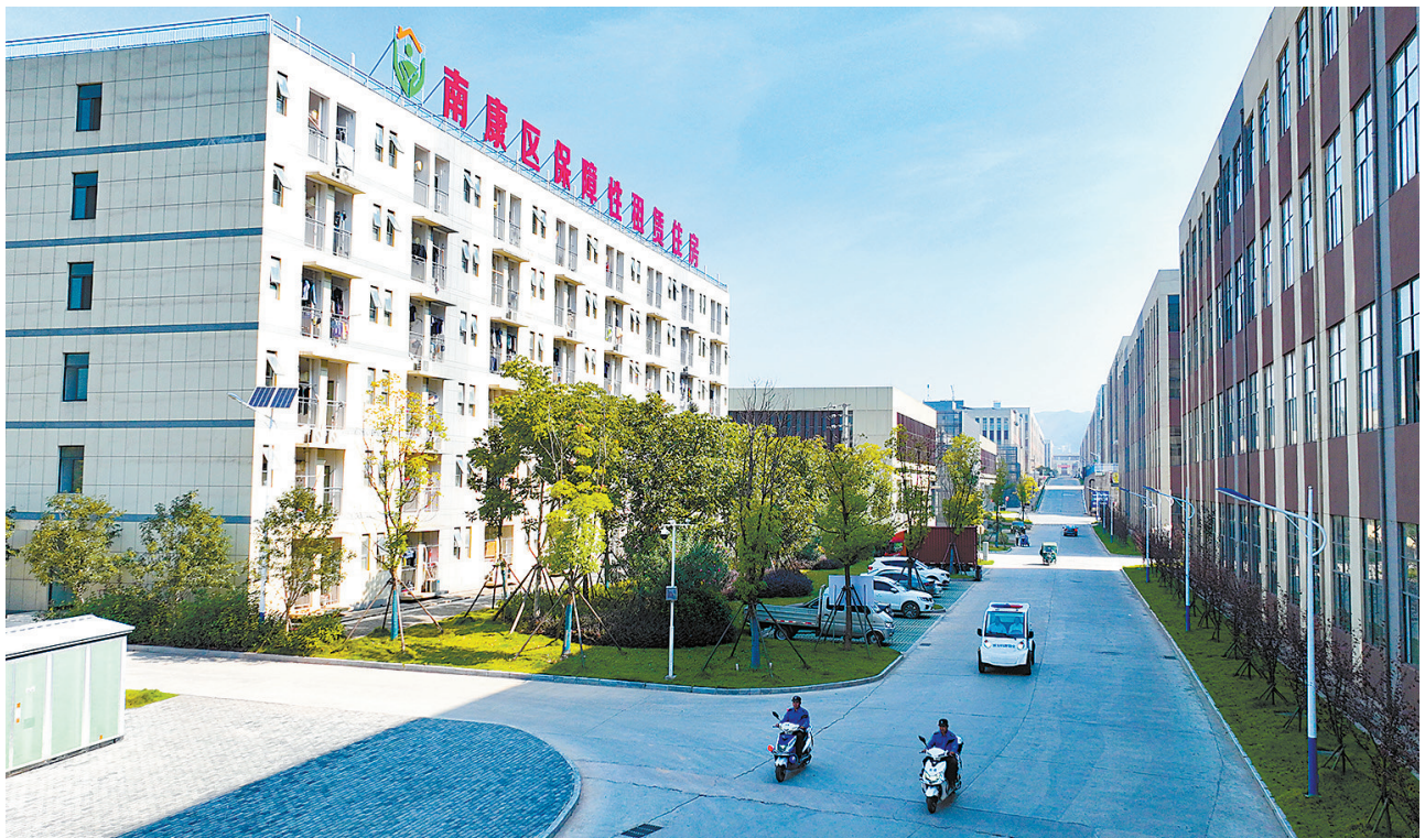
南康区龙回半岭家具集聚区二期宿舍楼(改造)保障性租赁住房为全省工业园区中规模最大的单个公租房项目,有效解决了当地务工人员租房难题。