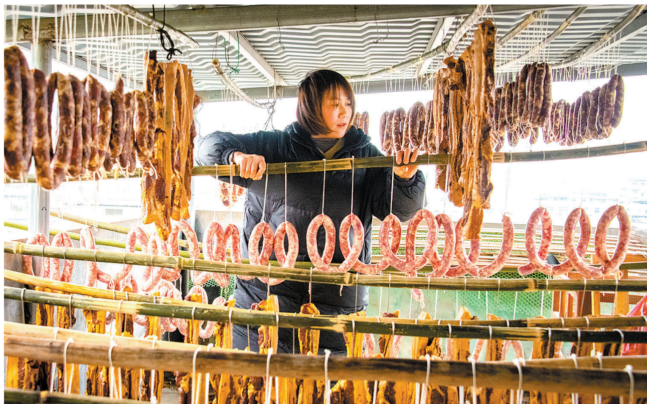
12月23日，定南县历市镇的一处小院内，一居民抓住晴好天气，晾晒自己制作的腊肉、腊肠。入冬以来，定南腊味腌制进入繁忙期，家家户户精心晒制腊肉迎新年，一串串腊肉、香肠挂在屋檐下，成为迎接新年的一道独特风景。

拨通赣州海关业务值班电话咨询出口要求及流程。赣州海关立即安排专人专岗“一对一”对接服务，开通“新鲜水果查验绿色通道”，收集柑橘类水果出口至巴西亚新几内亚相关检验检疫要求，指导企业选择国际贸易“单一窗口”两步申报模式，叠加证书“云签发”高效通关措施，使脐橙第二天就顺利出口。