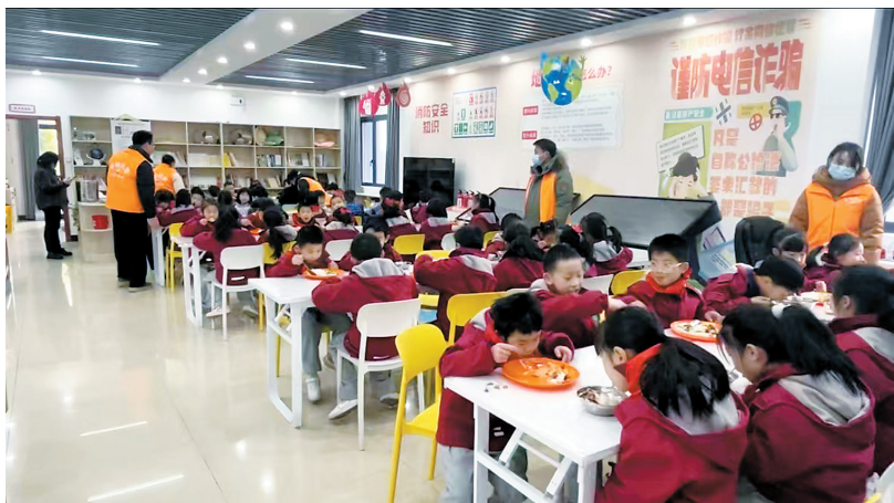
孩子们开心地用餐。

“我们现在把办公区域全都放在了最外面这块。”南外社区一工作人员介绍说,“这样一来,社区食堂就有足够空间了,除小朋友的用餐及托管服务得到有效监管外,周边的老人也能来用餐,这‘一老一小’的事就这样统筹办好了,基层治理各类问题也减少了。如今,社区的日常用电、用水,也由托管中心给解决了,社区的运行实