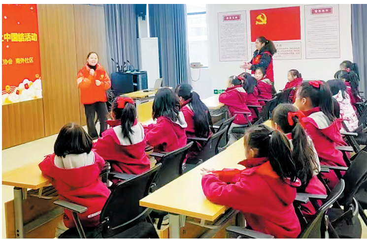
在老师志愿者的带领下,孩子们正在开展制作中国结活动。