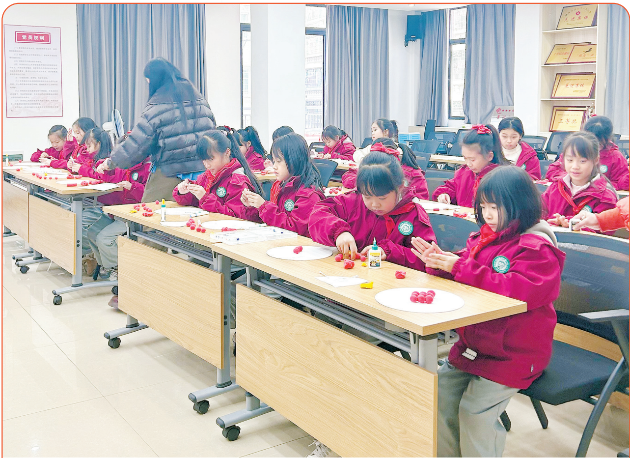
丰富多彩的综合实践活动,是孩子们的最爱。