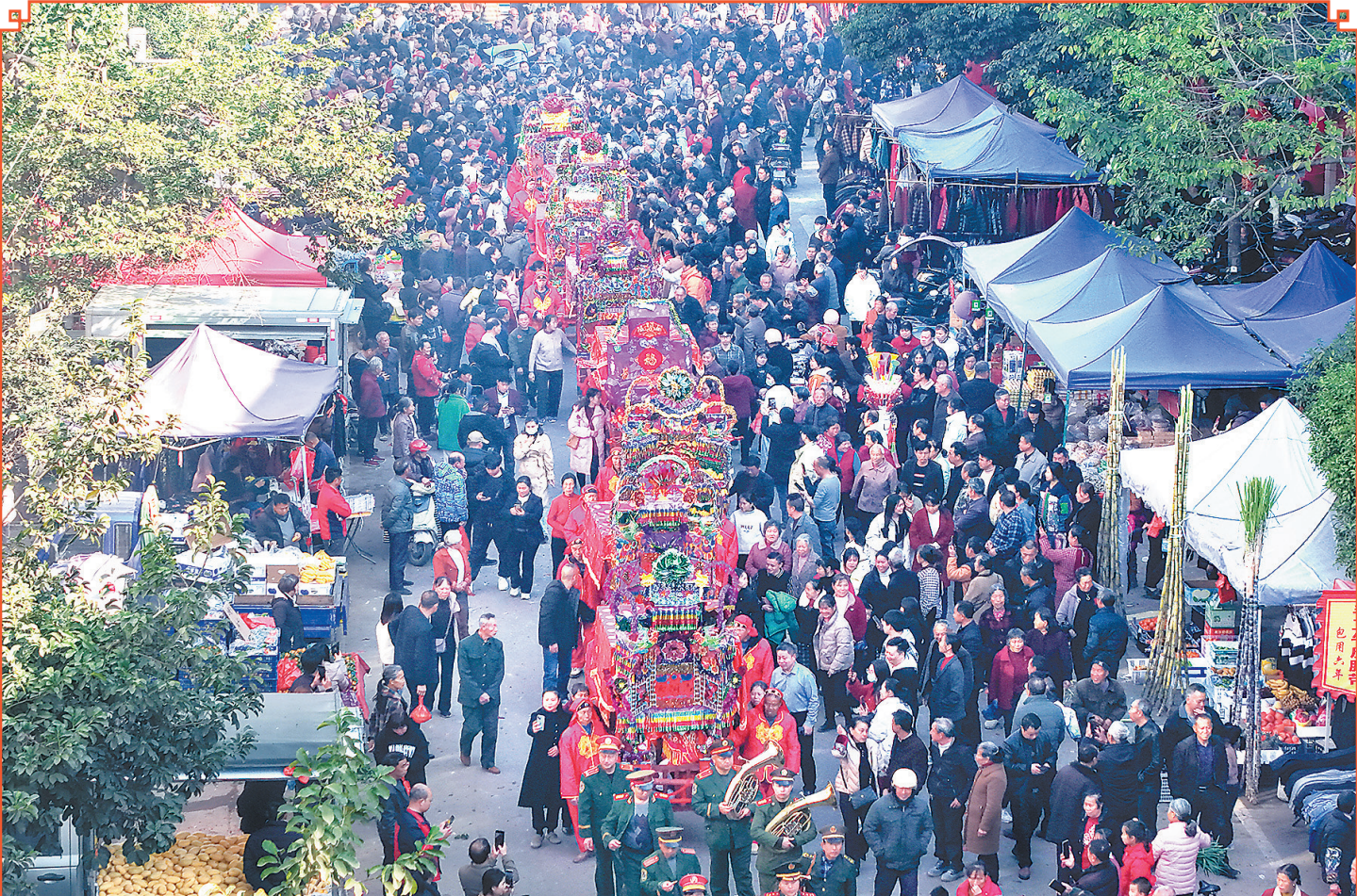
宁都县田头镇群众在举行客家民俗活动“妆古史”，现场人头攒动，吸引了众多游客参观。