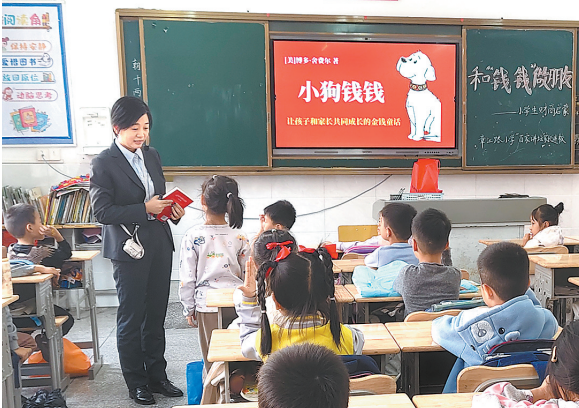
农行赣州分行青年志愿者走进校园为小学生普及金融知识。

“十四五”以来,农行赣州分行坚守服务“三农”初心,以金融创新破解乡村发展难题,让致富之花绽放在田间地头。截至2025年11月末,全行县域贷款、农户贷款余额分别为795亿元、180亿元,乡村产业、乡村建设贷款余额分别为243亿元、110亿元。