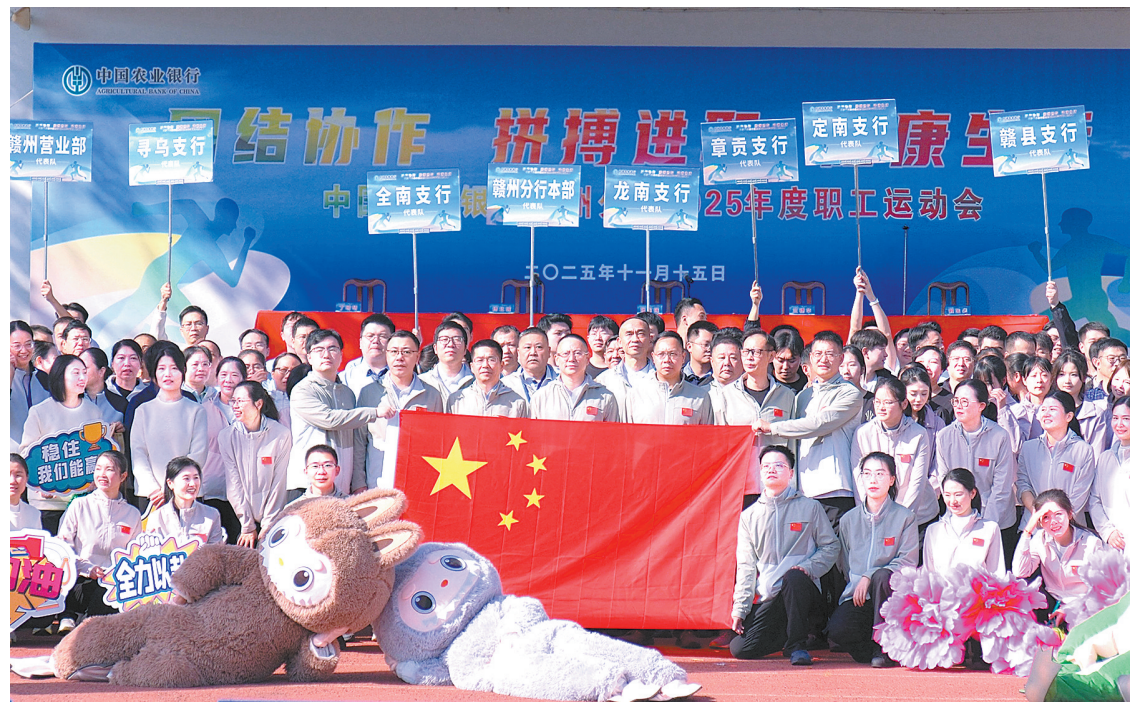
农行赣州分行举办2025年职工趣味运动会。

实体经济是金融的根基,产业振兴是苏区发展的关键。“十四五”期间,农行赣州分行紧扣赣州重点产业集群建设,聚焦电子信息、先进制造、现代服务业等重点领域,推出一系列定制化金融服务,支持了一批绿色产业、制造业、基础设施等领域重点项目。截至2025年11月末,全行实体、制造业、民营企业贷款余额分别为492亿元、134亿元、419亿元。