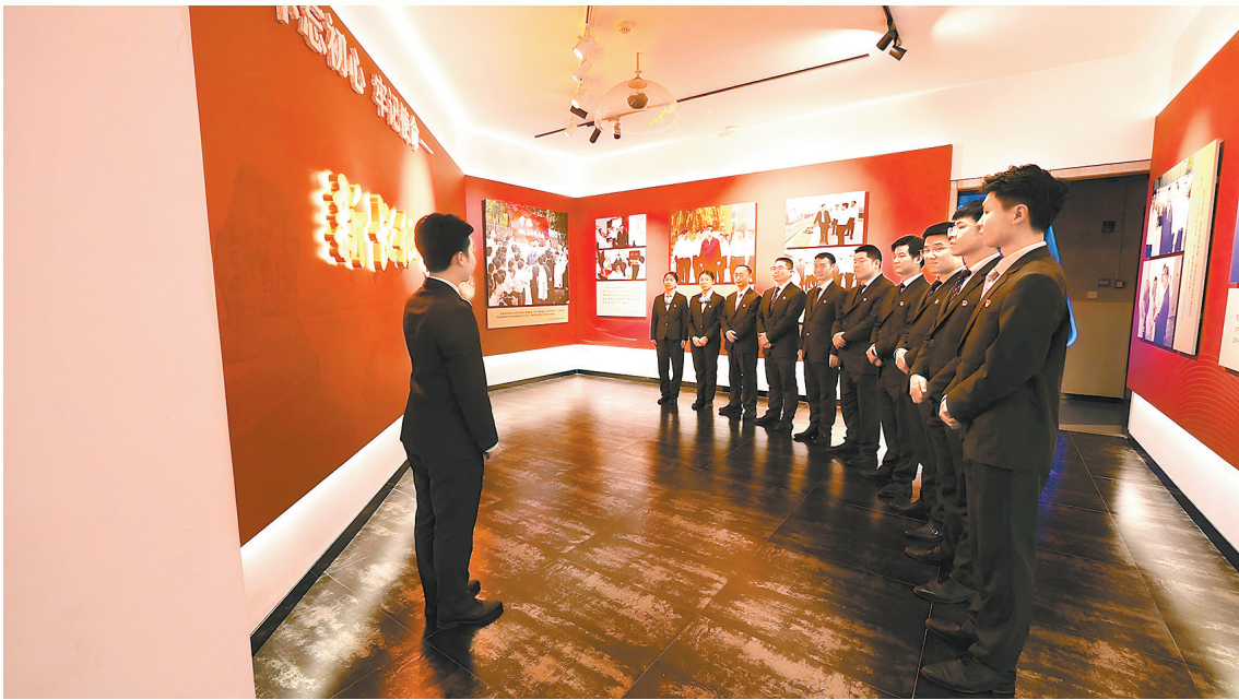
农行赣州分行于都支行组织党员干部赴中央红军长征出发地纪念馆开展党日活动。