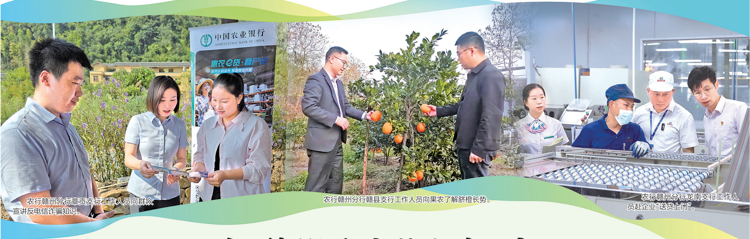
农行赣州分行章贡支行工作人员向群众宣讲反电信诈骗知识。