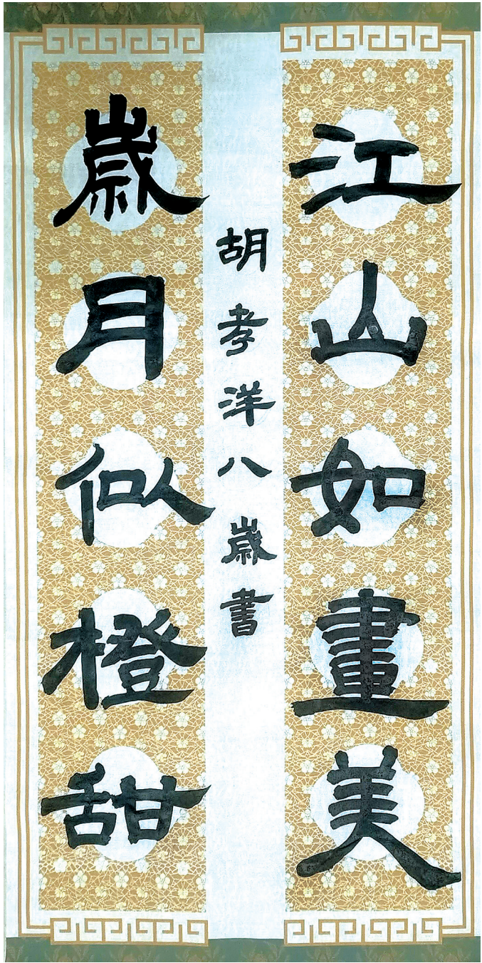
赣州市文清路小学环城路校区三(2)班 胡孝洋 (指导老师:谢李发生)