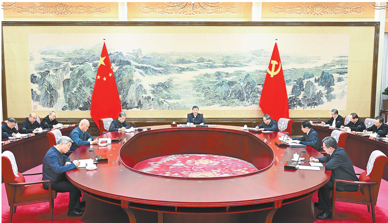
12月25日至26日,中共中央政治局召开民主生活会,中共中央总书记习近平主持会议并发表重要讲话。