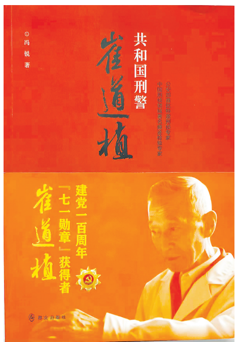
《共和国刑警崔道植》冯锐 著

写实质感,将1200余起重特大刑事案件的侦破过程写得扣人心弦,字里行间又展现了崔道植对党的感恩执念、对老伴的缱绻柔情,既有“大写的格局”,亦有“小写的温情”。这种刚柔并济的书写,避免了人物扁平化,让读者在震撼于刑侦奇迹的同时,更动容于人性的光辉。