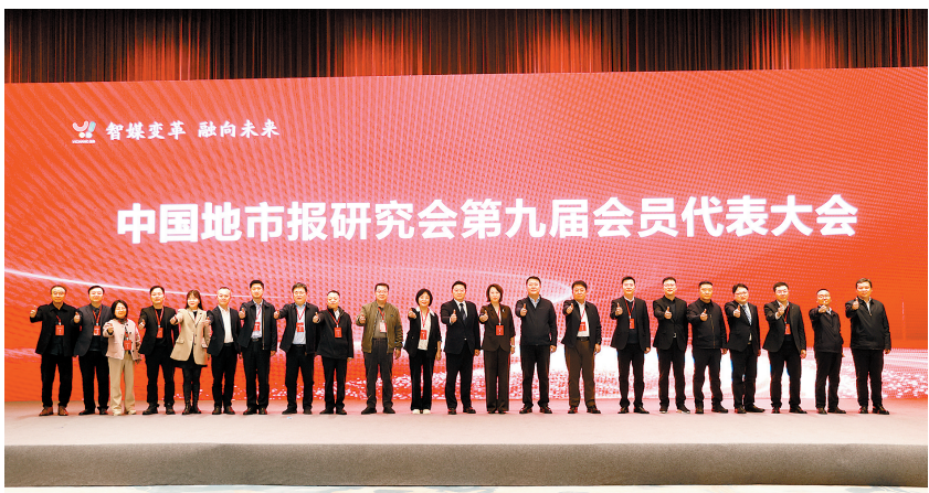
中国地市报研究会第九届会员代表大会会场留影。

“共抓大保护、不搞大开发”的殷殷嘱托,坚定不移走生态优先、绿色发展、创新驱动之路,发展成效斐然。2025年全地区生产总值达6464亿元,位居全国百强城市第47位。2026年是“十五五”开局之年,宜昌正朝着打造湖北省支点建设先行区的目标全速迈进。 活动现场,宜昌向全国媒体发出诚挚邀约,希望媒体朋友用笔触描绘山水之美,用镜头定格发展之姿,用声音传递奋进之声,让更多人爱上“来电宜昌”。湖北省新闻工作者协会主席向培凤也表示,湖北正奋力推进中国式现代化湖北实践,诚邀各位媒体走进湖北、走近宜昌,宣传推介这片发展热土。