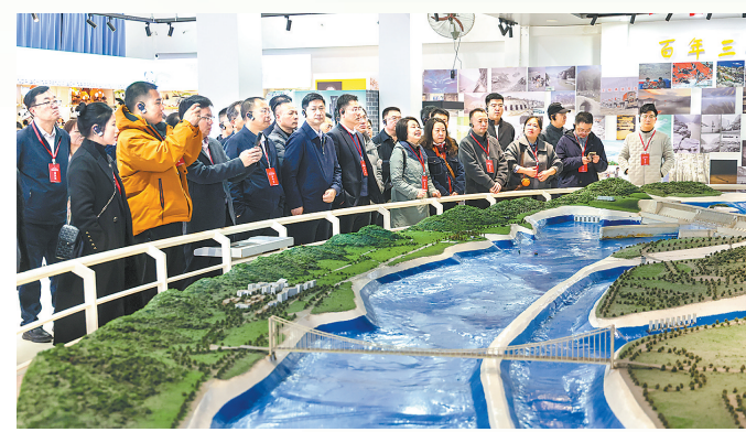
媒体代表参观三峡工程博物馆。