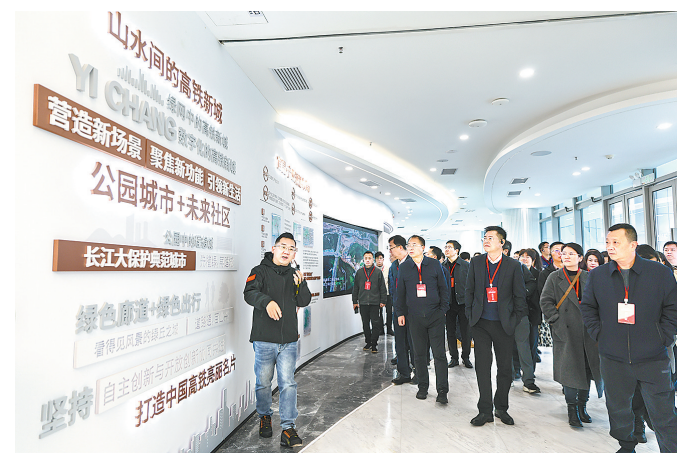
媒体代表参观高铁新城城市展厅。