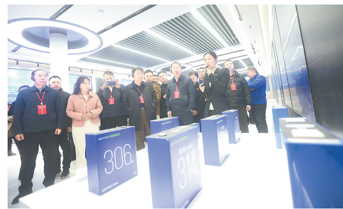
媒体代表调研楚能新能源基地。