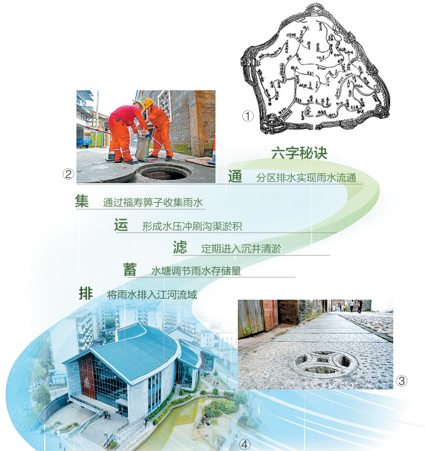
图①:清代绘制的福寿沟竣工图。 图②:赣州市政工作人员在对福寿沟管网进行清淤作业。 图③:位于赣州古城灶儿巷的集水窠子,集水窠子可以阻挡树枝、石块及日常生活垃圾进入福寿沟。 图④:福寿沟博物馆外景。

排水系统何以成为文物?赣州古城始建于东晋永和五年(349年)。章、贡二水在城北交汇成赣江,形成三面临水的三角地带,城市被水环绕。自北宋熙宁年间至今,正是依靠一套地下排水系统,古城900多年来极少发生严重内涝。这套依然在发挥作用的古老工程——福寿沟,既是保存完好的城市水利遗产,也被誉为中国古代“海绵城市”的典范。