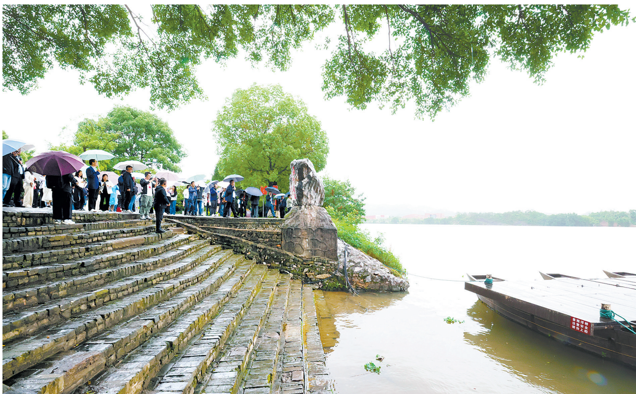
近日,众多游客走进于都县东门渡口,认真聆听红色历史讲解。东门渡口作为长征精神的重要传承载体,常年吸引各地游客前来追忆回望那段艰苦卓绝的峥嵘岁月,感悟革命先辈的奋斗初心,从中汲取砥砺前行的奋进力量。

从返迁安置房陆续交付,到“多户一表”改到了家门口,从医保基金省下的真金白银,到闲置养老服务中心重新开门——桩一件,都是群众看得见、摸得着的实惠。老百姓在点滴变化中感受到了真切温度。