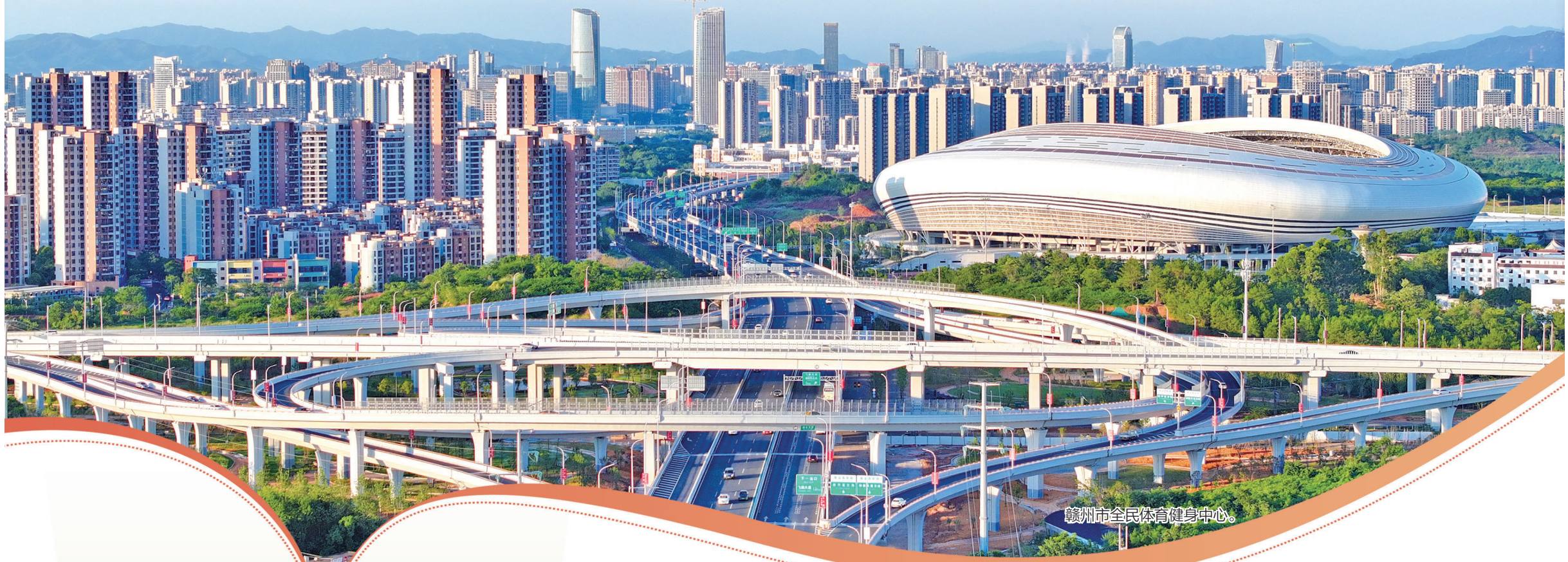
赣州市全民体育健身中心。

近年来,赣州蓉江新区坚持以习近平新时代中国特色社会主义思想为指导,在赣州市委、市政府的坚强领导下,锚定“城市核心、都会客厅”发展定位,瞄准“一区六中心、山水智慧城”发展目标,深入践行“1366”工作路径,以“闯”的魄力破局开路,以“创”的活力蓄势赋能,以“干”的定力惠民筑基,在赣南大地上书写着这座新城拔节生长的精彩答卷。