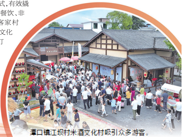
潭口镇江坝村米酒文化村吸引众多游客。

潮涌章江岸,奋楫正当时。展望“十五五”,在市委、市政府的坚强领导下,赣州蓉江新区这片热土将继续锚定高质量发展航向,勇担时代使命、永葆奋进初心,中流击水、逐浪高飞,奋力开创中国式现代化蓉江建设新局面!