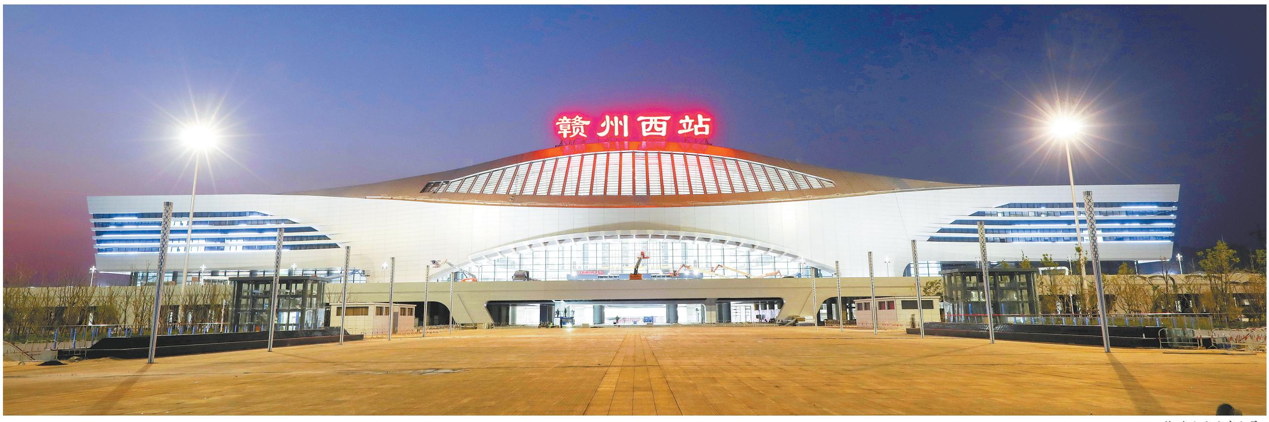
赣州西站站房全景。