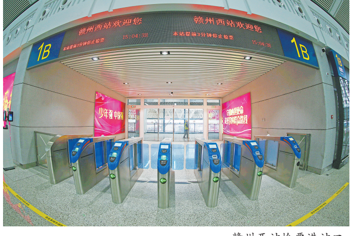
赣州西站检票进站口。

赣州西站位于赣州经开区凤岗镇，采用高架跨线式站房，车站一期总建筑面积9.1万平方米，其中站房建筑面积4.9万平方米，站台雨棚面积1.2万平方米。站房建筑共四层，分别为地下出站层、广场地面层、站台层和高架层。站房立面设计以科技和发展为建筑创作主题，立面造型像起飞的隐形战机，寓意“赣州之翼，展翅飞翔”，象征吉祥、发展、美好，以现代简洁的形式来表达。赣州以稀土为代表的新科技产业世界驰名，是城市响亮的名片和产业发展方向。赣州西站以菱形的律动建筑体隐喻多面的矿石晶体，以展翅腾飞的造型寓意科技引领产业升级和经济发展、赣州生机勃勃的城市精神面貌；雨棚为波浪形造型，寓意章江贡水相互交融，川流不息。