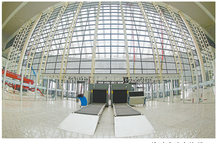
赣州西站安检入口。

昌赣高铁被誉为中国最“红”的高铁线，北起南昌，南至赣州，沿途人文荟萃，风光秀丽，共设13个站点，其中赣州境内设赣州西站、赣县北站和兴国西站。今天，从赣州西站出发，乘坐“飞驰”的高铁，一路北上，跟随我们记者的镜头，与这3个高颜值站点来一次约会吧！