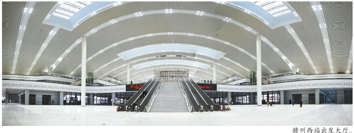
赣州西站出发大厅。