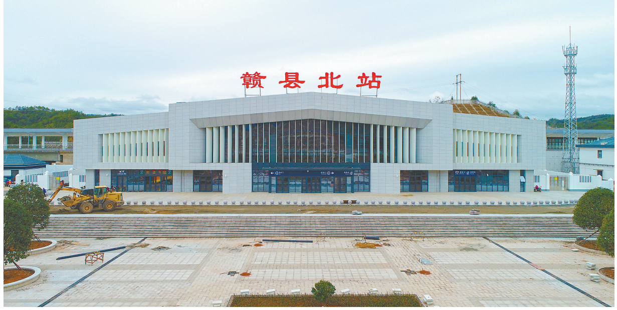
赣县北站站房外景。