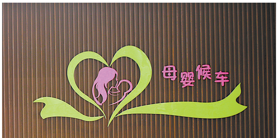
赣州西站温馨的母婴候车室标识。