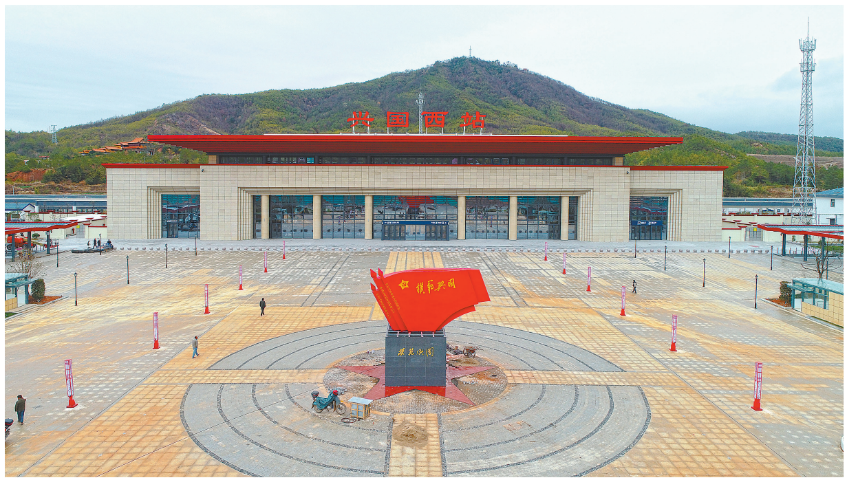
兴国西站站房外景。