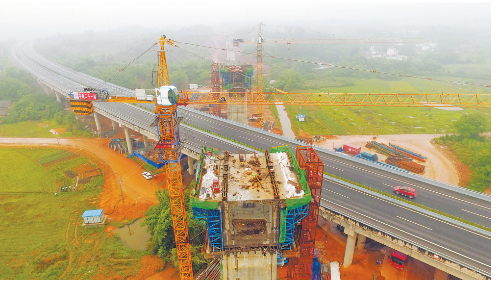
2016年5月23日,工人在建设昌赣高铁赣州段最长大桥——梨园特大桥跨越厦蓉高速处桥墩。梨园特大桥全长3.561公里,为全线控制性重难点工程之一。