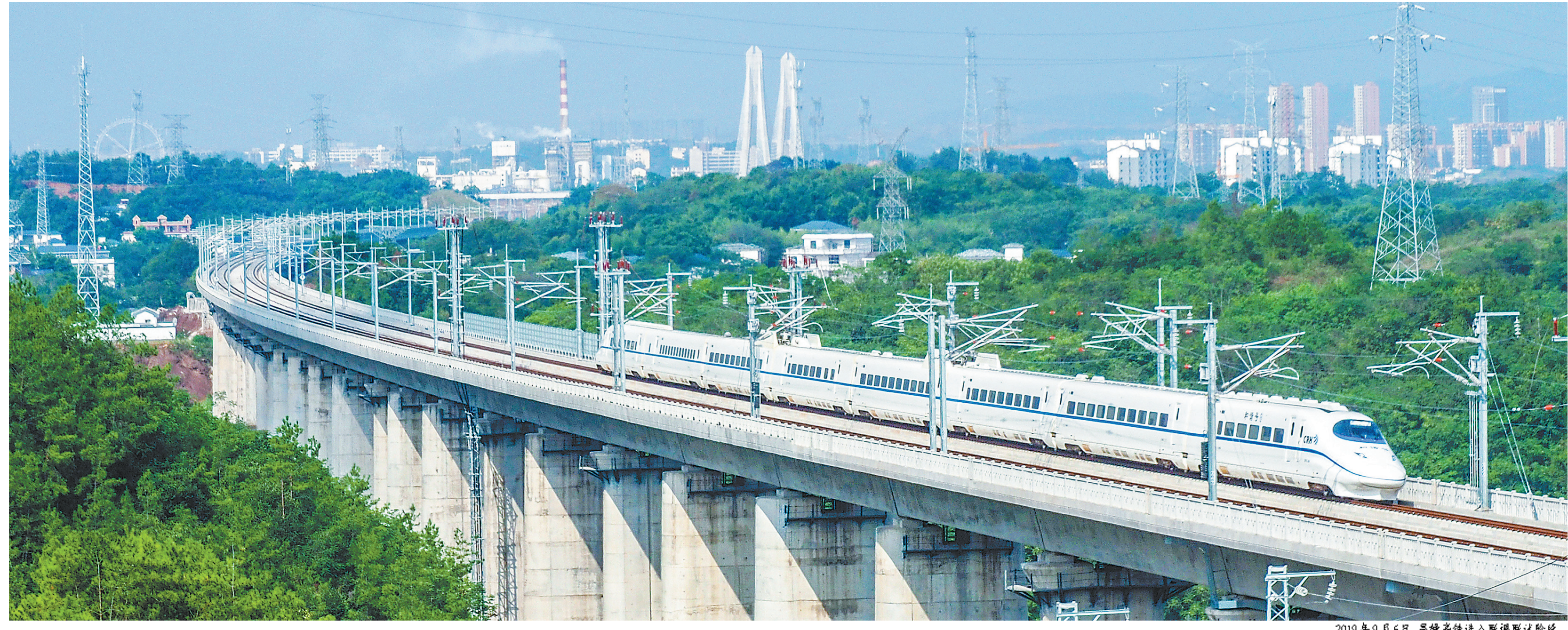
2019年9月6日,昌赣高铁进入联调联试阶段。