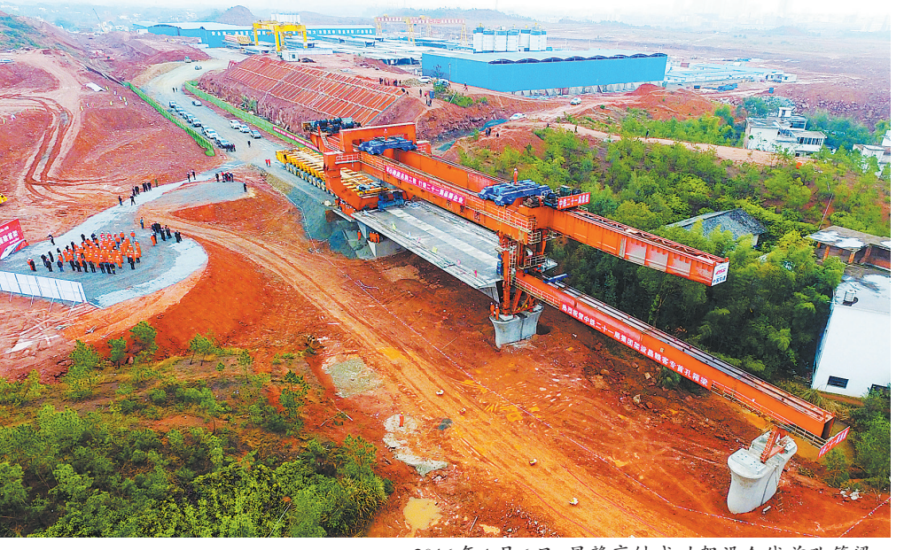
2016年1月6日,昌赣高铁架设全线首孔箱梁。