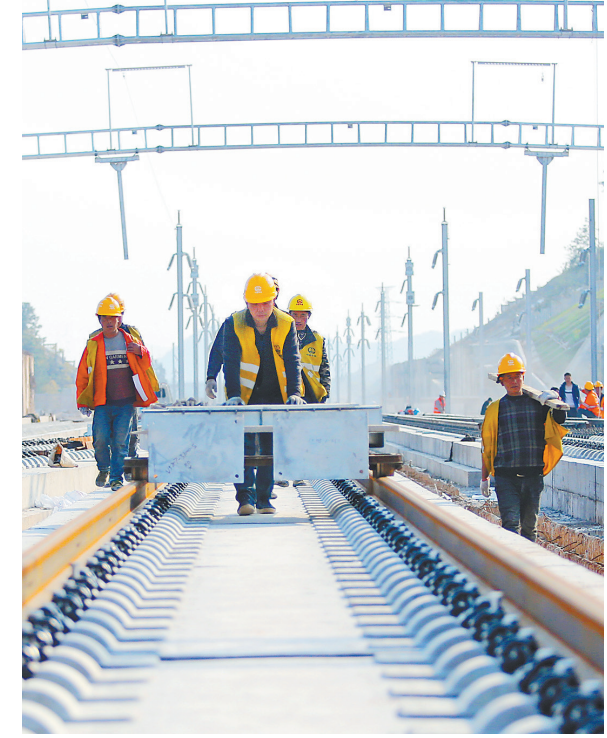
2019年3月11日,高铁建设者在昌赣高铁赣县北站作业,为全线静态验收作准备。