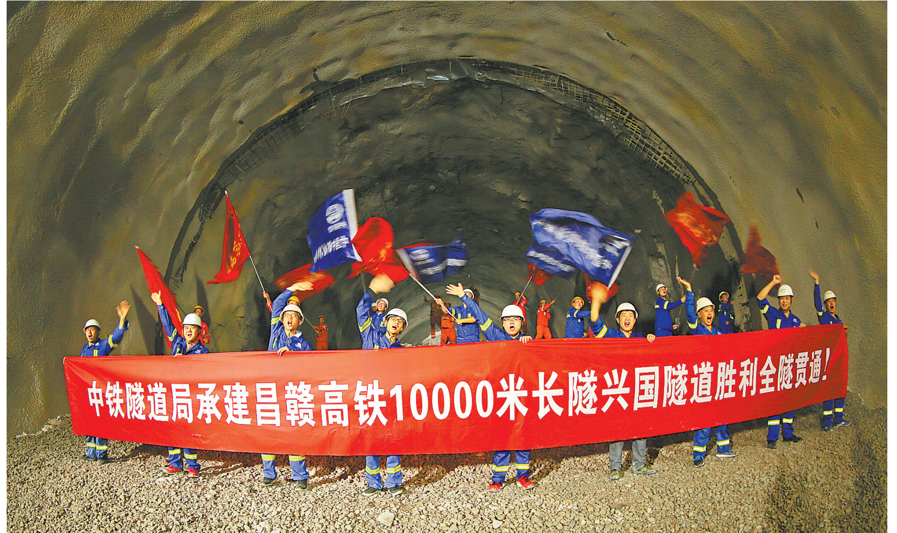
2017年11月20日,全长约10.4公里的昌赣高铁兴国隧道贯通。

着以省会南昌市为中心,高铁旅行时间为半径,构建2小时“同城生活圈”倒计时。 12月10日,昌赣高铁列车运行方案公布,铁路部门将安排开行24对赣州始发列车,3对瑞金始发列车以及8对跨线车。 12月26日,昌赣高铁正式通车。 随着昌赣高铁通车,赣州到南昌两个小时,时空距离被成倍压缩,省内“两小时交通圈”呼之欲出。不仅如此,昌赣高铁融入全国高铁网,可以北上联通京津冀、东进通达江浙沪、东南深入福厦沿海,凸显干线优势。昌赣高铁与京九铁路分工配合,既实现客货分线运输,又让沿线群众出行有了更多选择。对赣州人来说,这一天等待得太久了。 凡是过去,皆为序章;一切将来,等待开创。这一刻,是一个永远值得铭记的重大时刻,是一个开启高铁时代的崭新起点。乘风飞驰电掣的时代列车,赣州向着更加美好的未来,一路向前、奋勇向前。