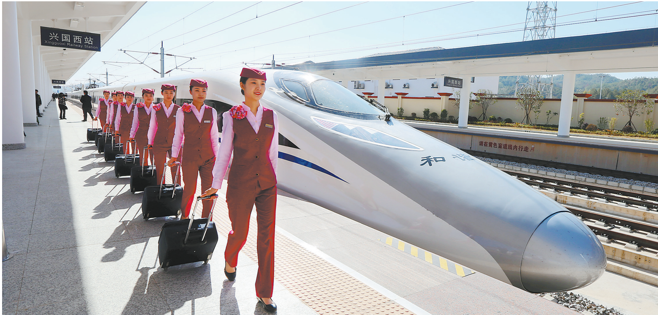
2019年12月10日,高铁列车员进行服务演练。