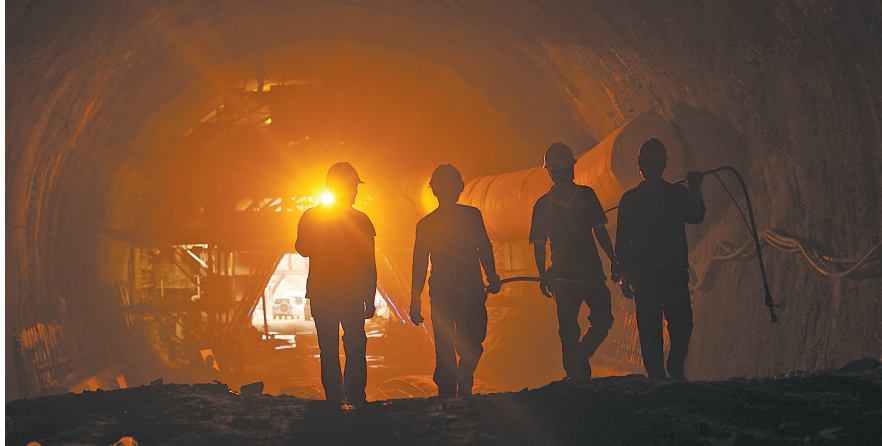
2017年5月18日,高铁建设者在昌赣高铁老田山2#隧道施工。