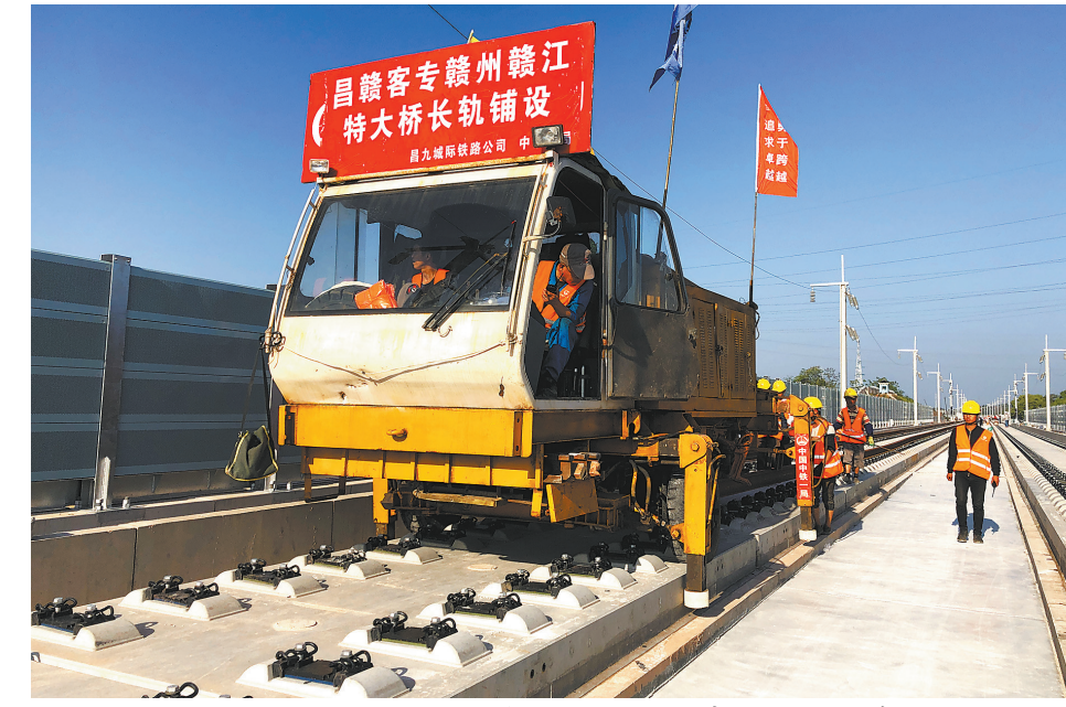
2019年4月17日,昌赣高铁赣州赣江特大桥开始铺轨。