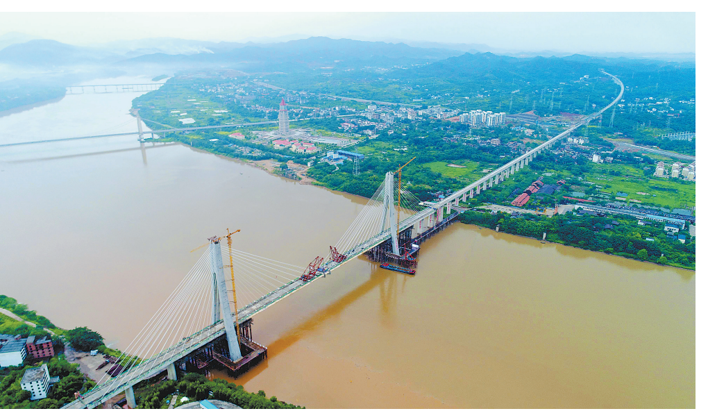
2018年8月31日,国内首座设计时速350公里大跨度高速铁路斜拉桥——赣州赣江特大桥成功合龙。