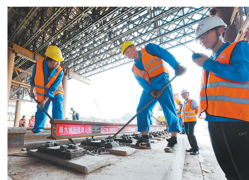
2019年6月3日,随着最后一对500米长轨在赣州西站稳稳落下,标志着昌赣高铁全线长轨贯通。