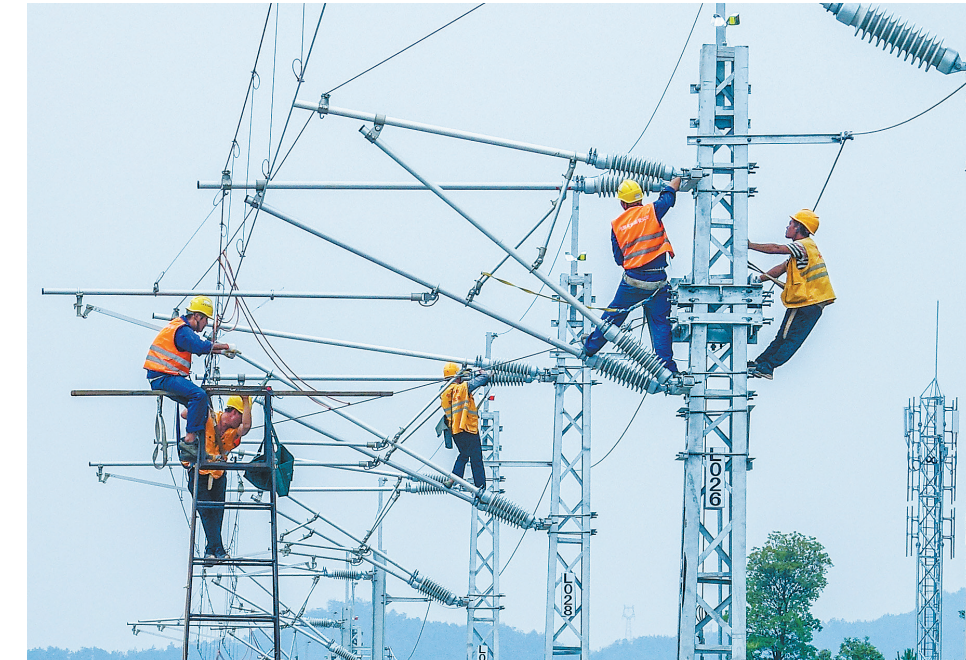
2019年8月23日,昌赣高铁全线接触网开始送电。