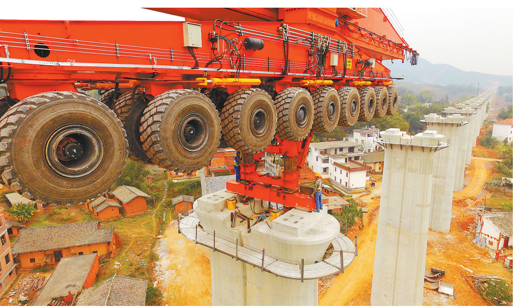
2016年10月8日,架梁“神车”在昌赣高铁万嵩特大桥架梁作业。万嵩特大桥全长2131.315米,全桥设计为66个桥墩台。