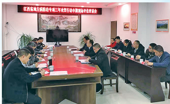
省级专家评估小组在上犹召开地方病防治专项三年攻坚行动中中期现场评估座谈会。

1.定义:因环境缺碘,人体摄取碘不足所致机体缺碘导致的一系列疾病,以前命名为地方性甲状腺肿和甲状腺癌,现在统称为碘缺乏病。 2.危害:主要会引起甲状腺肿大、甲状腺功能低下、克汀病,以及导致妇女发生流产、死胎