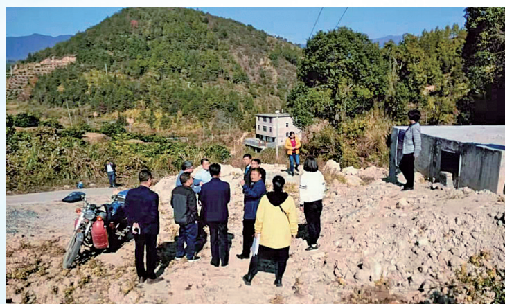
省级专家评估小组调研宁都县改水工程和其他孕产问题。