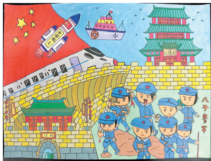
《虔州情 复兴梦》 赣州市沙石吉坦小学六(2)班 余陈芳 (指导老师:曾卉)